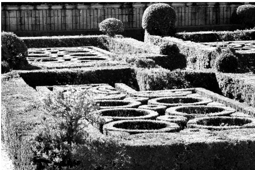
Боскеты восточного сада

толического движения стала Испания, в которой за короткий период было изгнано и истреблено около трех миллионов неверных — мавров, морисков, евреев. Хозяйства страны были обескровлены податью «алкабалы» (десятины) в пользу церкви. Более того, Филипп управлял страной, пользуясь помощью ученых-правоведов преимущественно духовного звания. Нити принятия решений сходились в Мадрид, куда беспристрастным монархом был перенесен двор и органы власти. С этого времени Испания, вслед за Францией и Англией, обретает большую столицу. Управление обширными владениями осуществлялось через коллегии, которые были сосредоточены в Эскориале.