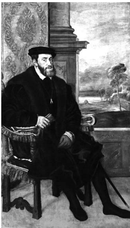
Великий бургундец Карл V, отец Филиппа II

Место. В селение Эскориал в 45 километрах к северо-западу от Мадрида можно попасть двумя путями, на электричке и автобусом. Автобус № 661 от станции метро «Монклоа» доставит быстро — за 25 минут, и дешево — 2,5 евро. Небольшие селения, дубовые, сосновые и буковые рощи, рыжие полянки с овцами, старые каменоломни (от слова щебень, шлак, «эшкориа» и происходит имя Эскориал). Однако ради настоящего восхождения лучше добираться железной дорогой. Тогда вы около десяти минут идете от станции по клюшкой изогнутой калео де Санта-Роза на запад, в сторону гор, оказываетесь возле парка, примыкающего к апсидам знаменитого монастыря, и попадаете в пешеходную аллею этого парка — пасео де Санта-Мария. Это лучший путь по прямой, как стрела, дорожке, обсаженной соснами-пиниями с длинной пушистой иголкой. Солнце и в феврале светит по-испански прямо. В синеве растворяется хребет Сьерра-де-Гваддарамы. По деревьям скачут веселые белки, и впереди сквозь зелень начинает мелькать купол собора Сан-Лоренсо. Здесь, вдали от шумного Мадрида человек испытывает редкое в мире чувство единения