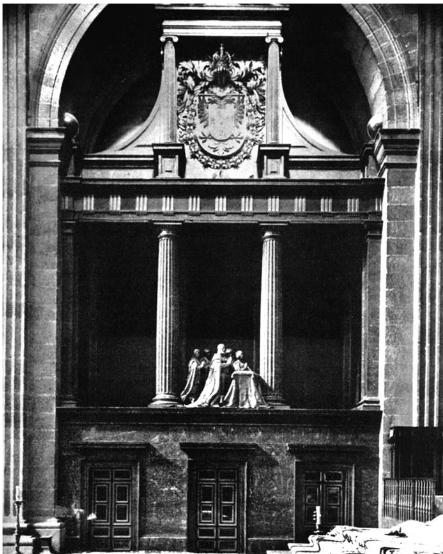
Семейство Карла V в Главной капелле Сан-Лоренсо

работал и завершил в 1582 году его помощник архитектор Хуан де Эррера (1530–1597), считающийся чуть ли не главным автором комплекса. Именно де Эррера придал ансамблю стилистическое единство, ответив на запрос Фи-