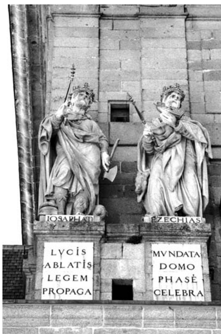
Ветхозаветные Иосафат и Иезекия на западном фасаде собора Св. Лаврентия

лигой, которую в конце концов побил на Эльбе под водительством герцога Альбы. Фактически Карл V был самым влиятельным монархом XVI столетия.