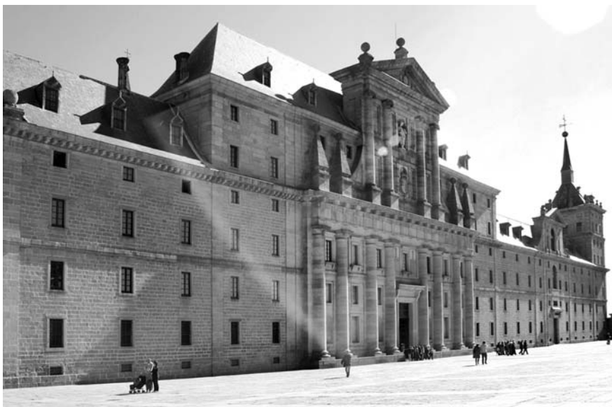
Эскориал, западный фасад

например, в константинопольской Айя-Софии, в Испании времен Реконквисты, наоборот, церковь очень часто поселяется в здании бывшей мечети и синагоги. Ну а мавританские замки превращаются в дворянские резиденции. Испанские идалго вкусили мускусов, и восточная роскошь им понравилась. Характерные потолки артесонадо, из небольших брусков дерева, были освоены испанцами в совершенстве. Мудехар господствовал от Мадрида до Балеарских островов. Явление было распространено во всех областях столь широко, что в конце XV века специальным указом было запрещено изображение святых мавританскими каменщиками [2].