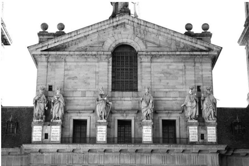
Ветхозаветные цари на главном фасаде Сан-Лоренсо

ния и только в письменной форме, не пересекаясь друг с другом, и король за- сидивался над бумагами до изнурения.