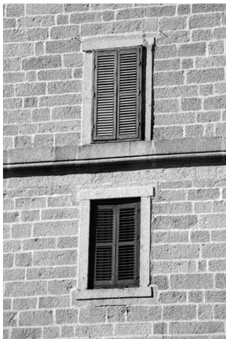
Окна библиотеки неотличимы от сотен других окон Эскориала

искренне считал себя ответственным перед Богом за спасение душ своих подданных, защиту их от мусульман и протестантской ереси. Имея такие же царственные претензии, что и Карл — глава дома Габсбургов, властитель Испании, Нидерландов и заморских земель, — Филипп принципиально изменил методы управления: не бесконечные походы, но католическая реформа и удержание власти из одного, в том числе географического, центра. И если Карл V — это всемирная империя, то Филипп II — испанский абсолютизм.