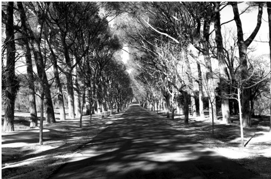
Пасео де Санта Марія

крытой во двор двухъярусной аркадой представляет собой настоящий образец платереско: мощный массив куба дематериализован «ювелирным» бриллиантовым рустом.