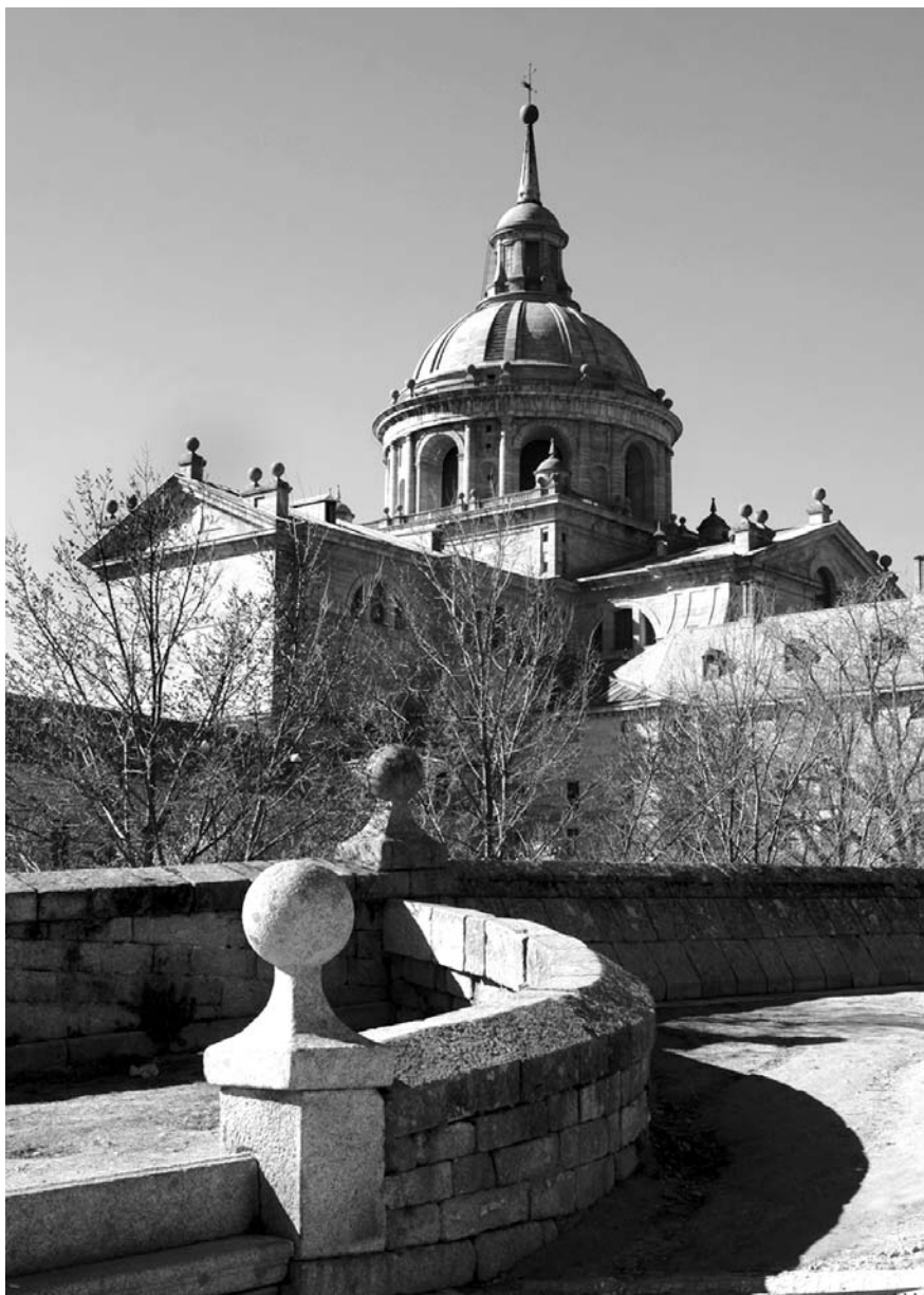
Шахматы — имманентная сущность Эскориала