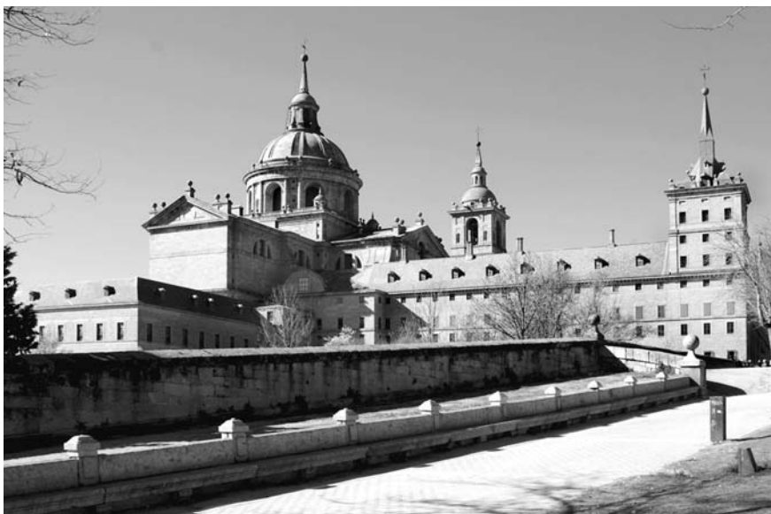
Эскориал, вид с северо-востока

дворец Карла V в гранадской Альгамбре (архитекторы Педро и Луис Мачука, Хуан де Ареа) строится в 1526–1535 годах. В плане — идеальный квадрат с циркульно-круглым двором диаметром 30 м, четыре входа по сторонам света. Двухъярусная дорико-ионическая колоннада охватывает арену для турниров и корриды: реплика на римский цирк, колоннаду Св. Петра и Темпьетто Браманте, — Педро Мачука учился в Риме. Этот образец зрелого Возрождения стилистически никак не связан со строениями арабского дворца в Альгамбре, но в чистоте приемов предвещает Эскориал.