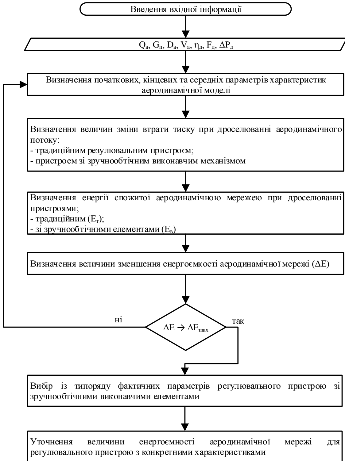
Рисунок 2 – Структурно-логічна модель управління енергоємністю аеродинамічної мережі при регулюванні витрати в системах вентиляції та аспірації

мережі ( D_a ), швидкість аеродинамічного потоку ( V_a ), коефіцієнт місцевого опору ( \eta_d ), площа поперечного перерізу аеродинамічного потоку ( E_d ) та величин втрат тиску ( \Delta P_d ).