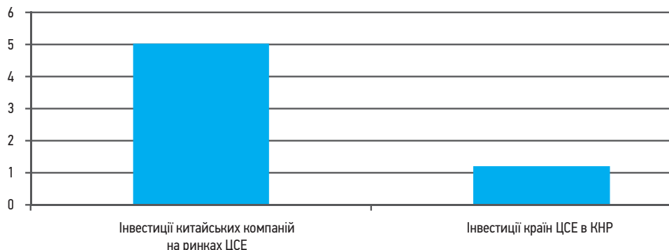
Рис. 2. Інвестиції китайських компаній та країн ЦСЄ в економіку