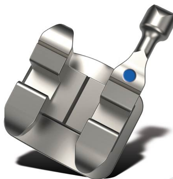
McLaughlin™ Bennett system 4.0