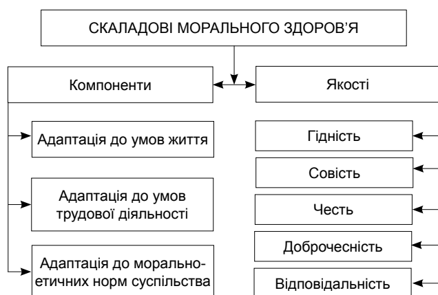
Рисунок 1 – Складові морального здоров'я

циплінованості як однієї з важливих особистісних якостей громадянина (Круцевич, 2008) [6]. Але слід зазначити, що патріотизм і мораль – це не одне і те ж саме. Мораль виступає регулятором поведінки, межею, яку людина не може перетнути навіть під тиском суспільства чи загрозою свого життя та для її підтримки необхідні вольові якості (совість). Патріотизм – це фактор, що впливає на поведінку людини, але, на відміну від моралі, патріотизм потребує наявності предметів та образів поклоніння (герби, прапори, штандарт, місто, країна, селище, сподади та інше), а його рівень патріотизму залежить від подій, які стосуються всієї країни, регіону, а не окремих особистостей.