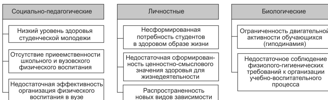
Рисунок 4 — Предпосылки разработки концепции формирования здорового образа жизни студентов в процессе физического воспитания

Цель концепции – формирование эффективной системы обеспечения физического, психического, социального и духовного комфорта, способствующего воспитанию гармоничной и высокоинтеллектуальной личности, достижению высокого уровня сознательности и ответственности всех участников образовательного процесса в