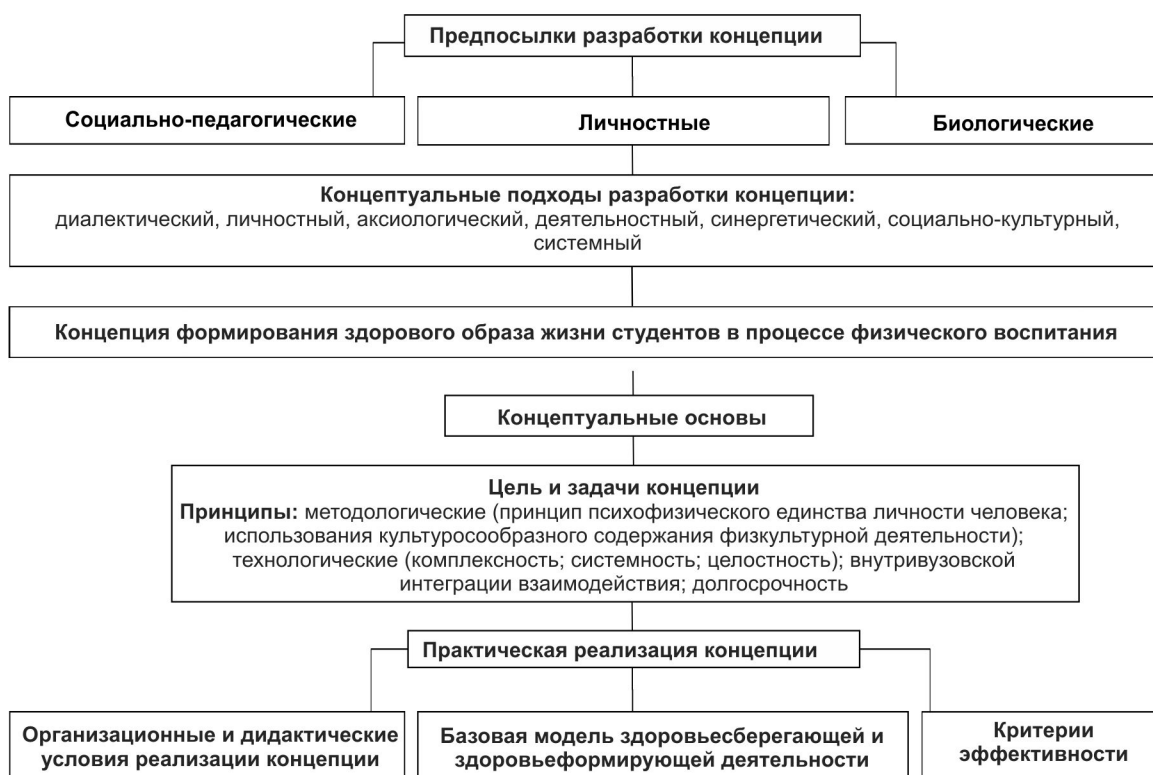
Рисунок 3 – Концепция формирования здорового образа жизни студентов в процессе физического воспитания [13]

анкетирования и студентов, и экспертов, свидетельствует о перспективности современных реформ и их осуществимости, что открывает путь к достижению высокого уровня качества образования и перспективу успешной интеграции Украины в европейское и мировое образовательное пространство.