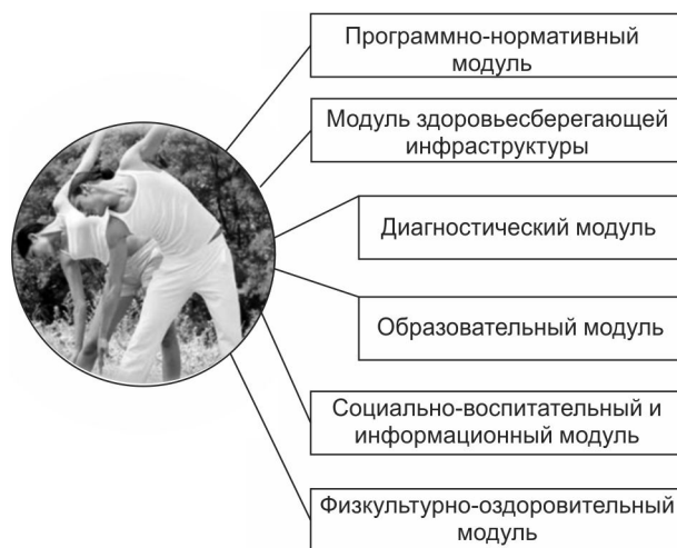
Рисунок 6 — Базовая модель здоровьесберегающей деятельности студентов высших учебных заведений

Выводы. Исследование проблемы содействия здоровьесбережению личности в условиях высшего педагогического образования привело к необходимости установить причинно-следственные связи и зависимости, проявляющиеся в форме ведущих тенденций и принципов. Педагогическое содействие здоровьесбережению личности в педагогических вузах может рассматриваться как педагогическая концепция, структурными составляющими которой являются методологические подходы, предпосылки, установленные тенденции и принципы, педагогические условия эффективности. Инновационная педагогическая технология