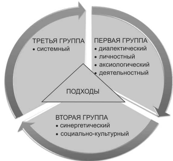
Рисунок 5 — Концептуальные подходы разработки концепции формирования здорового образа жизни студентов в процессе физического воспитания [13]