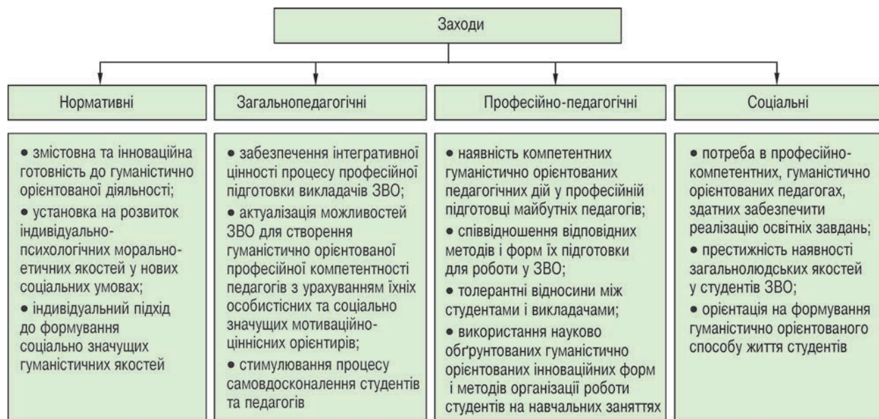
Рисунк 1 – Комплекс методичних заходів, які забезпечують досягнення студентами належного рівня розвитку загальнолюдських моральних якостей

власні судження, думки, погляди, ідеї тощо.