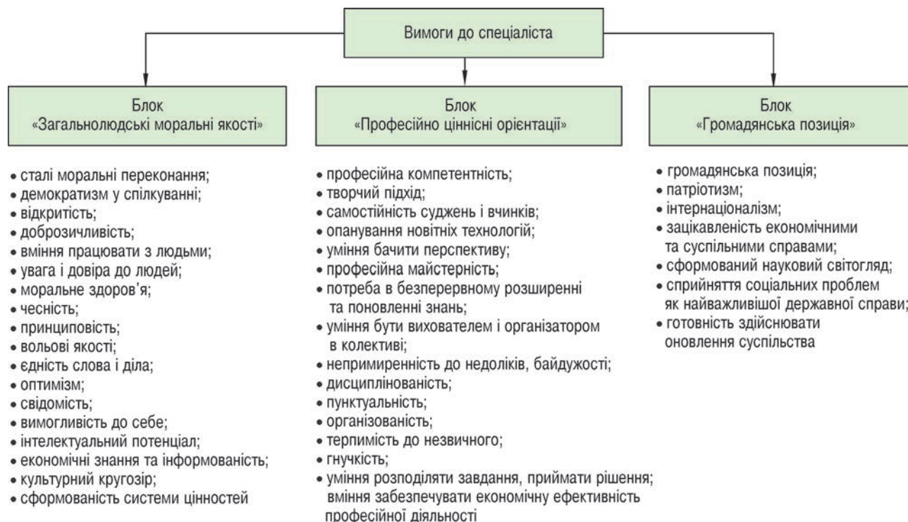
Рисунок 5 – Блоки професіограми спеціаліста сфери фізичної культури і спорту з урахуванням гуманістичної спрямованості фахової освіти

Сьогодні навчання у ЗВО не завжди чинить помітний вплив на світогляд, перебудову свідомості студентів, формування їхніх переконань, установок, ціннісних орієнтацій на створення гуманістичного підґрунтя розвитку сучасного суспільства. Зазвичай гуманістично орієнтована особистість формується у процесі виховання в родині, спілкування з найближчим оточенням, в освітніх закладах, під впливом засобів масової інформа-