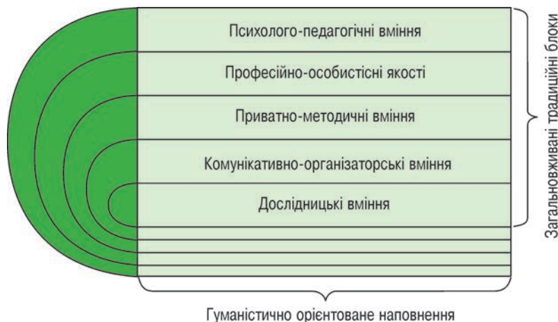
Рисунок 3 – Основні складові професіограми спеціаліста сфери фізичної культури і спорту

цесу з урахуванням морально-етичної складової фахового рівня викладачів, наявність у них умінь, навичок та наполегливості у впровадженні соціально-гуманістичної діяльності у ЗВО.