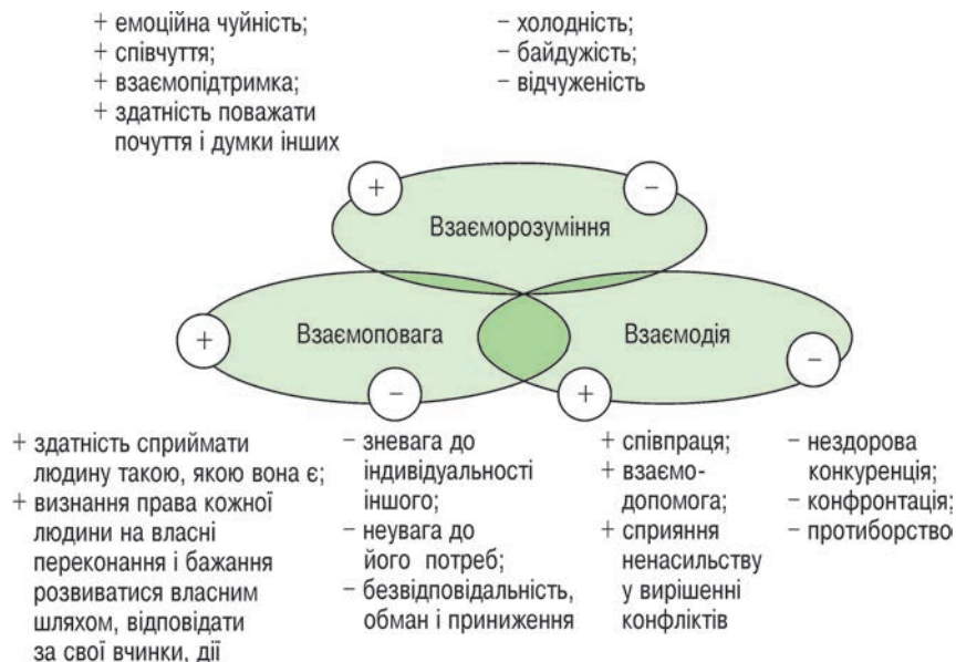
Рисунок 4 – Складові гуманності, що визначають характер стосунків між людьми

З огляду на зазначене, гуманізація процесу підготовки фахівців сфери фізичної культури та спорту полягає у ставленні педагога до студентів як до особистостей зі своїми індивідуальними властивостями, прихильністю, вимогами та системою цінностей. Свої стосунки учасники гуманістично оріє-