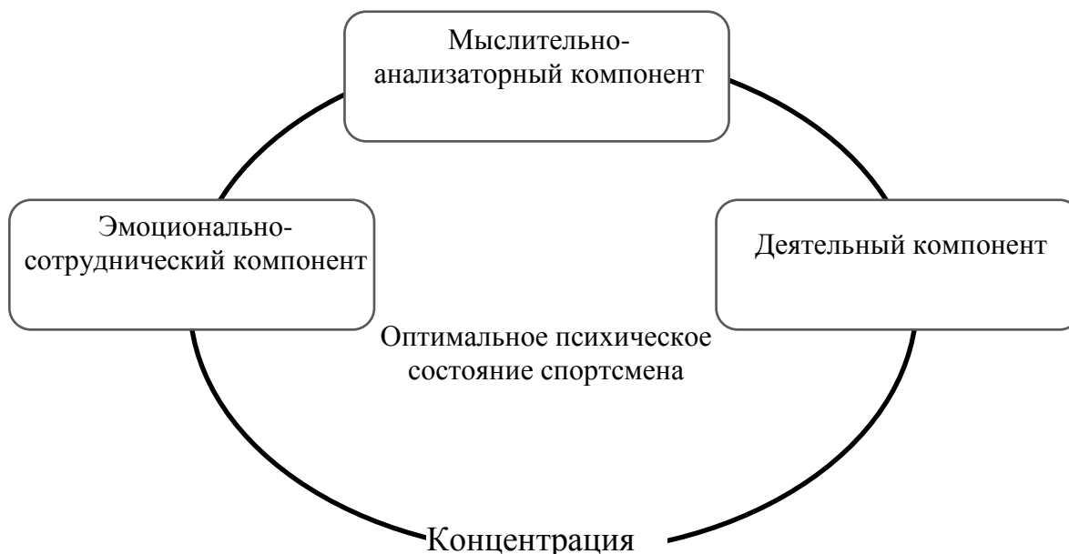
Рис. 2. Структура оптимального психического состояния спортсмена-баскетболиста

На основании проведенного исследования 3-компонентная структура оптимального психического состояния А.В. Алексева, на наш взгляд, является наиболее приемлемой. Вместе с тем, поскольку мы рассматриваем оптимальное психическое состояние в прикладном плане, с учетом особенностей игровой деятельности баскетболиста, необходимо уточнение его компонентов. В связи с этим мы предлагаем физический, мыслительный и эмоциональный компоненты оптимального психического состояния спортсмена заменить соответственно на деятельный, мыслительно-анализаторный и эмоционально-сотруднический. Схематическое отображение структуры представлено на рис. 2.