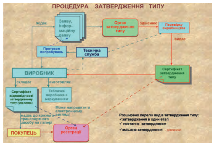
Рис. 3 – Процедура затвердження типу за Регламентом ЄС № 167/2013

Процедура затвердження типу, описана у Регламенті ЄС № 167/2013, представлена на рис. 3. Вона принципово не відрізняється від процедури затвердження типу, яка описана в Технічному регламенті затвердження типу, але на цей час у повній мірі не запроваджена в Україні, зокрема і стосовно інституційних органів (органу затвердження типу) та документів, які подаються на реєстрацію транспортного засобу і засвідчують його безпечність. У Регламенті ЄС № 167/2013 розширено перелік видів затвердження типу, зокрема розглядається також змішане затвердження типу.