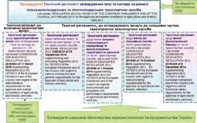
Рис. 5 – Структура оновленої нормативно-правової бази щодо затвердження типу і введення в обіг сільськогосподарських і лісгосподарських транспортних засобів

У найближчі три-чотири роки планується розробити