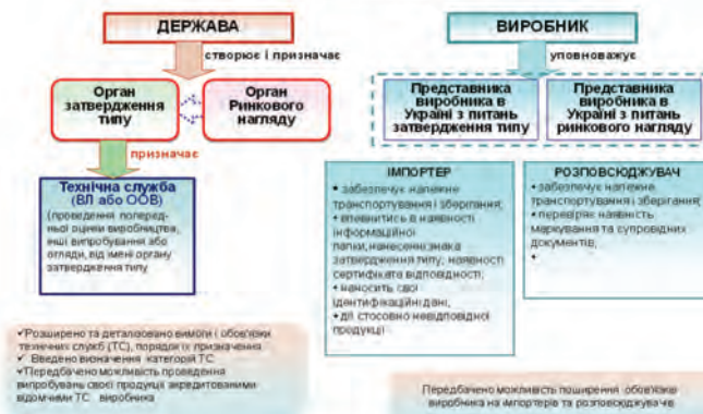
Рис. 4 – Суб'єкти господарювання, які задіяні в процедурі затвердження типу та введення в обіг