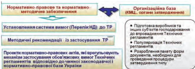
Рис. 1 – Нормативно-методична, нормативно-правова та організаційна основа впровадження Технічного регламенту затвердження типу

Основна частина. Для забезпечення практичного застосування Технічного регламенту затвердження типу УкрНДІПВТ ім. Л. Погорілого, як консультаційно-методичний центр (далі – КМЦ), займався розробленням необхідної для цього нормативно-методичної і нормативно-правової бази, здійснював заходи з підготовки виробників та інших суб'єктів господарювання, задіяних у процесі затвердження типу, до впровадження Технічних регламентів і їх популяризації (рис 1).