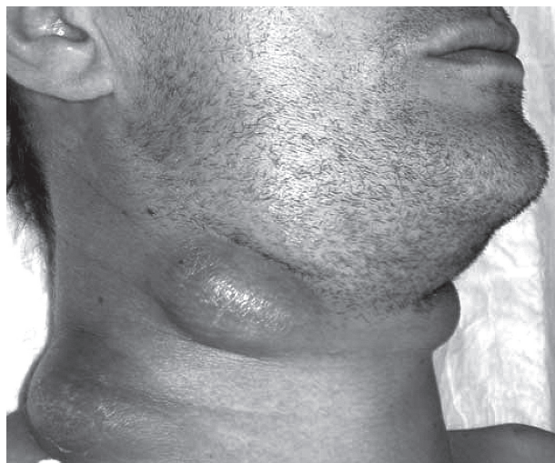
Рис. 2. Туберкулезный лимфаденит у ВИЧ-инфицированного пациента

осуществляли по общим хирургическим правилам. У 40 пациентов произведена биопсия лимфоузла шеи, у 34 – подмышечной, у 6 – паховой области. Биопсированные лимфоузлы проходили стандартную обработку, срезы окрашивали гематоксилином и эозином. Диагноз туберкулеза устанавливали на основании обнаружения возбудителя в биопсийном материале при окраске по Цилю–Нильсену, гистологической верификации – наличии бугорков (туберкулов), включающих 3 типа клеток (лимфоциты, эпителиоидные и многоядерные гигантские клетки Пирогова–Лангханса). При подозрении на опухоль и верификации гистотипа опухоли производили иммуногистохимическое исследование в Национальном институте рака (Киев).