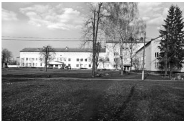
Фото 7. Головний корпус санаторію. Праворуч барачні приміщення. Нині це корпуси санаторію. 2016 р.