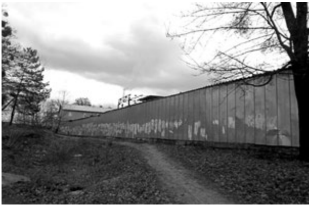
Фото 6. За високим парканом на території колишнього санаторію «Лісовий» сховався завод «Світ саун». Поряд озеро. 2016 р.