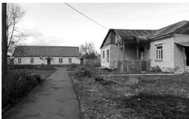
Фото 8. Стародавні будинки санаторію, які функціонують і нині. Праворуч клінічна лабораторія. 2016 р.