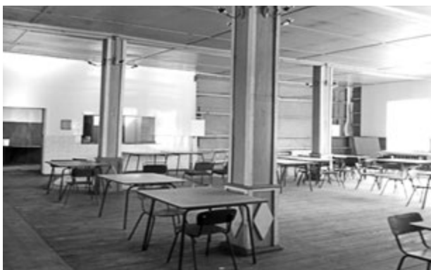
Фото 9. Приміщення харчоблоку. Кухня, літня їдальня. 2016 р.

місцевого жителя Миколи Бурляя [8]. Головним лікарем був О.М. Слонімський. Лікували дітей радянських службовців, сиріт, 5 % склали місцеві жителі. Санаторій був розрахований на 150 ліжок. За даними акту ревізійного обстеження райсануправління, умови для проживання та лікування дітей були незадовільними. Юні пацієнти спали в тісних бараках на старих дерев'яних або металевих ліжках, привезених із Харкова, чи на тапчанах. Не було вбиральні. Іноді на одному ліжку спало по двоє дітей. Годували п'ять разів на день, бракувало молока, але м'ясо їли щодня. Нерідко продукти, зокрема картоплю та інші овочі, купували у місцевих жителів. Історії хвороби не вели, дані про хворих лікар записував просто в зошиті. Персоналу було 22 особи. Часом співробітники не отримували зарплати, траплялися випадки крадіжки майна та харчів. Отже, райсануправління вирішило закрити заклад № 78 і перевести дітей у санаторій в Пущі-Водиці [8].