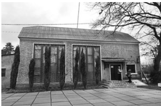
Фото 1. Краєзнавчий музей імені Миколи Островського. 2016 р.