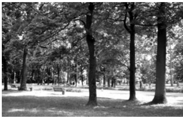
Фото 10. Парк Перемоги. Колишня територія дитячого санаторію «Барвінок». 2016 р.