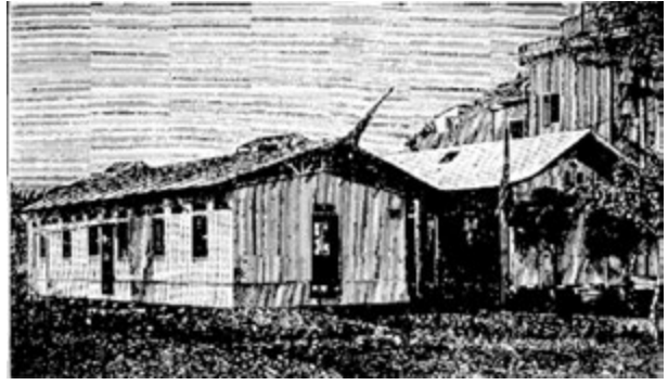
Фото 5. Декерівські бараки