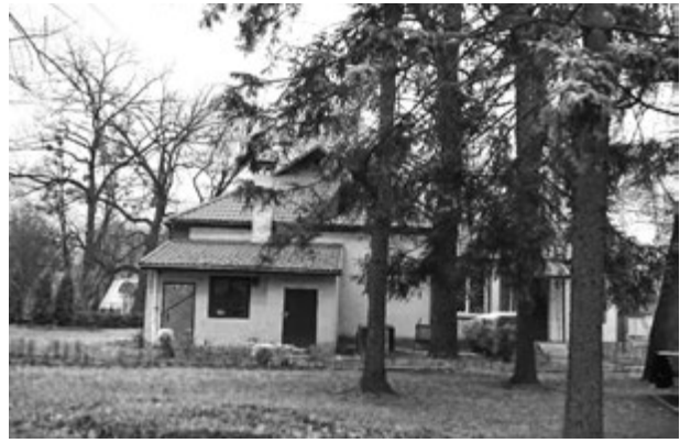
Фото 11. Одне з приміщень дитячого санаторію «Барвінок». Праворуч колишня школа, де працює мерія Боярки. 2016 р.