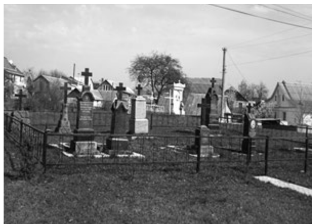
Фото 2. Свято-Михайлівська церква на березі Йосипського озера. Праворуч стародавній церковний цвинтар. 2016 р.