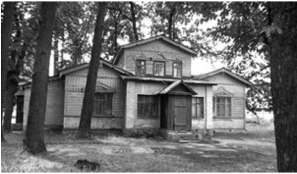
Фото 4. Стара дача — колишній корпус санаторію. 2016 р.