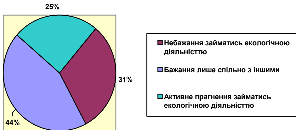
Рис. 2. Спрямованість підлітків на участь у екологічній діяльності

Більшість учнів 6–7-х класів визнає за живими істотами право на життя і свободу, однак 94,6% допускають природонебезпечні дії щодо них; кількість етичних мотивів у дівчат всіх вікових категорій більша, ніж у хлопців, і ставляться до природних об'єктів вони по різному (так, до неживої природи, як до ресурсу у 7 класі ставляться 37, 5% хлопців і лиш 6,7% дівчат, а як до частини природи, яка потребує такого ж захисту, як і жива – 25% хлопців і 66,2% дівчат). У споживанні мотиви етичного характеру зустрічаються лише у 6-х класах. В усіх інших вікових категоріях превалюють традиційні економічні мотиви. Якщо виокремити площини взаємодії школярів з природою – живі істоти, нежива природа, екосистеми та природні ресурси – рівень етичної мотивації зменшується від першого до останнього.