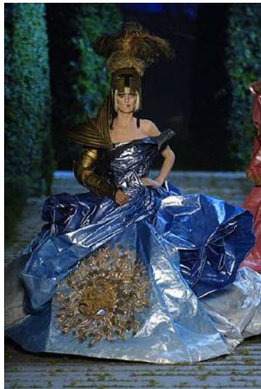
Рис. 10. John Galliano. Приклад еkleктичного поєднання в одній моделі елементів середньовічних лицарських обладунків та рокайльної сукні 10