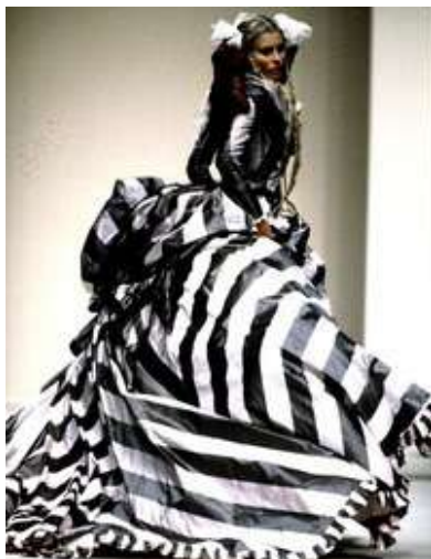
Рис. 3. John Galliano. Смугаста сукня, створена за мотивами жіночого костюма XVIII–XIX ст. Колекція «Втеча юної принцеси Лукреції з більшовистської Росії», haute couture, весна–літо 1994 3