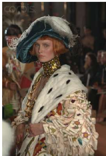
Рис. 4. John Galliano. Стилiзація ренесансної сiмари й берето. Колекція «A Voyage on the Diorient Express, of the Story of the Princess Pocahontas», haute couture, осiнь–зима 1998–1999 4