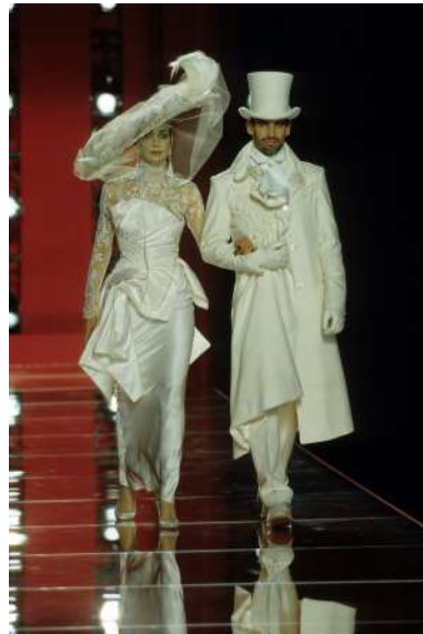
Рис. 8. John Galliano. Приклад деконструкції елементів чоловічого костюма 8