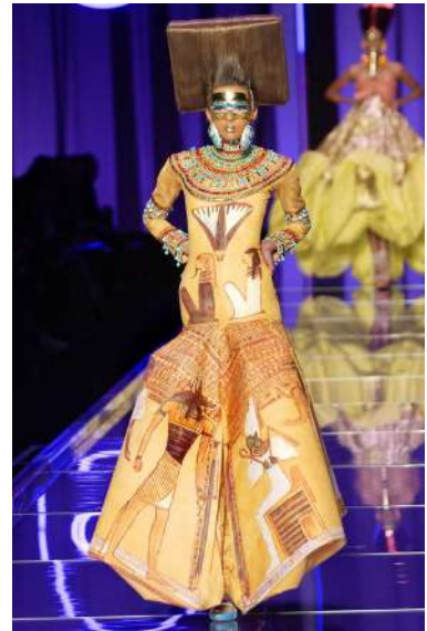
Рис. 9. John Galliano. Приклад стилізації форм давньоєгипетського костюма 9