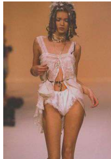
Рис. 2. John Galliano. Біла жіноча сукня, створена на основі трансформації білизни у верхній одяг та стилізації форм історичного костюма. Колекція «Наполеон і Жозефіна», haute couture, весна–літо 1992 2