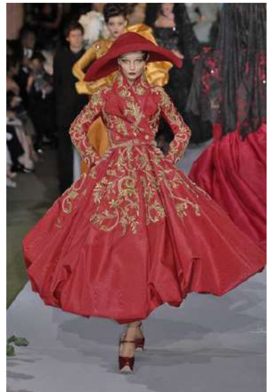
Рис. 12. John Galliano. Приклад поєднання форм і силуету «New Look» з орнаментальними мотивами бароко 12