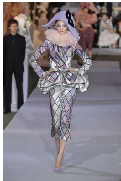
Рис. 13. John Galliano. «Костюм Арлекіна» 13