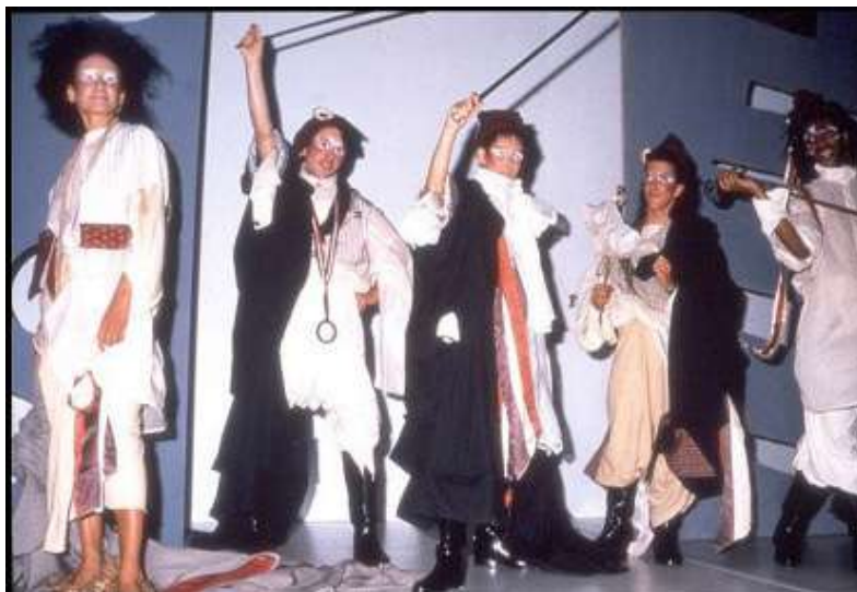
Рис. 1. John Galliano. Колекція «Les Incroyables» (1984; Коледж Saint Martins) 1