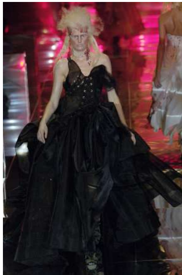
Рис. 11. John Galliano. Приклад готескної інтерпретації сукні доби рококо 11