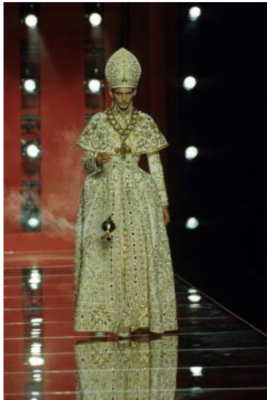
Рис. 7. John Galliano. Костюм «священика» 7