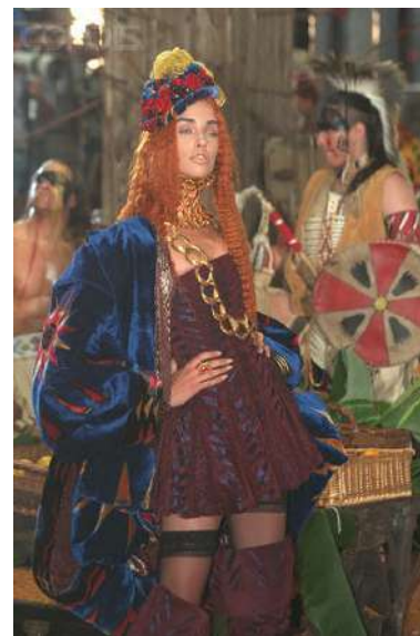
Рис. 5. John Galliano. Стилiзація ренесансного колета. Колекція «A Voyage on the Diorient Express, of the Story of the Princess Pocahontas», haute couture, осiнь–зима 1998–1999 5