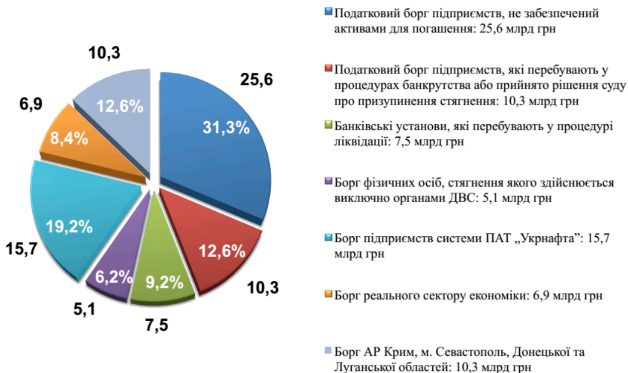
Рис. 1. Структура податкового боргу в Україні станом на 1.09.2017 р.

За даними ДФС, загальна сума податкового боргу в Україні станом на 01.09.2017 року склала