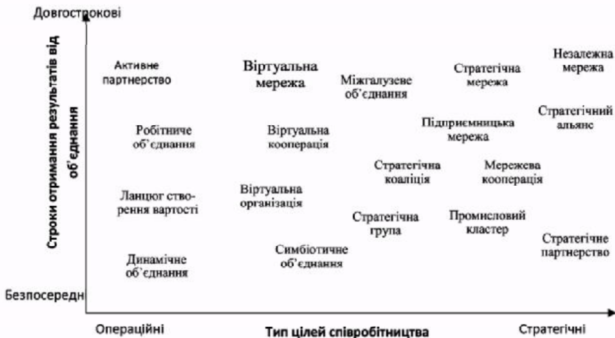
Рис. 1. Форми міжфірмової кооперації

Значним внеском досліджень у цій області став опис широкого спектру мережевих форм – спільних підприємств, об'єднаних правлінь, асоціацій, картелів, соціальних і персоналізованих мереж. На рис. 1 представлені різні форми взаємодії, що відносяться різними дослідниками до мереж, які не можуть іменуватися мережами в чистому вигляді.