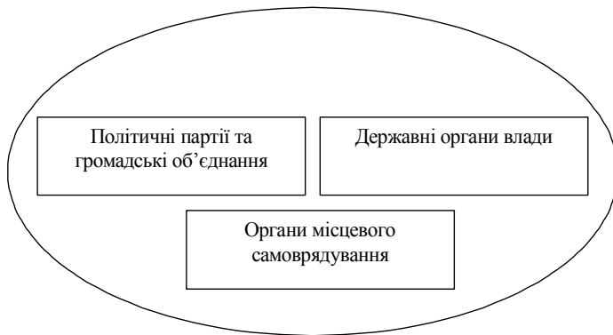
Рис. 1. Структура системи державного управління

державного управління включається не тільки виконавча гілка влади, але вся система організації державної влади (законодавча, виконавча та судова гілки влади), органи місцевого самоврядування та політичні партії й громадські організації (рис. 1).