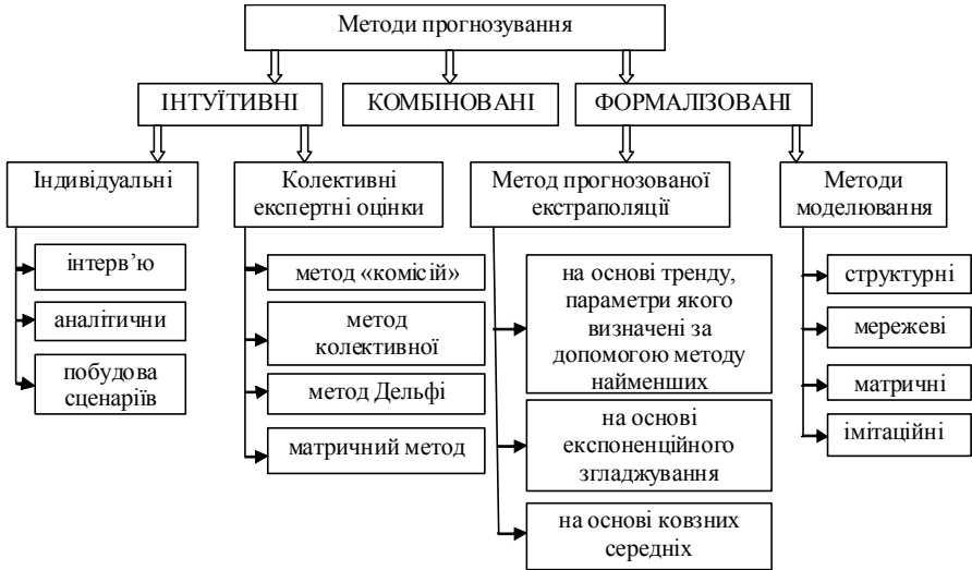
Рис. 2. Методи прогнозування

Стабільність у часі найважливіших бюджетних нормативів і ставок оподаткування у країнах із розвинутою ринковою економікою, наявність однорідних статистичних показників дають змогу широко застосовувати для такого прогнозування методи прикладної статистики й економетричні моделі.