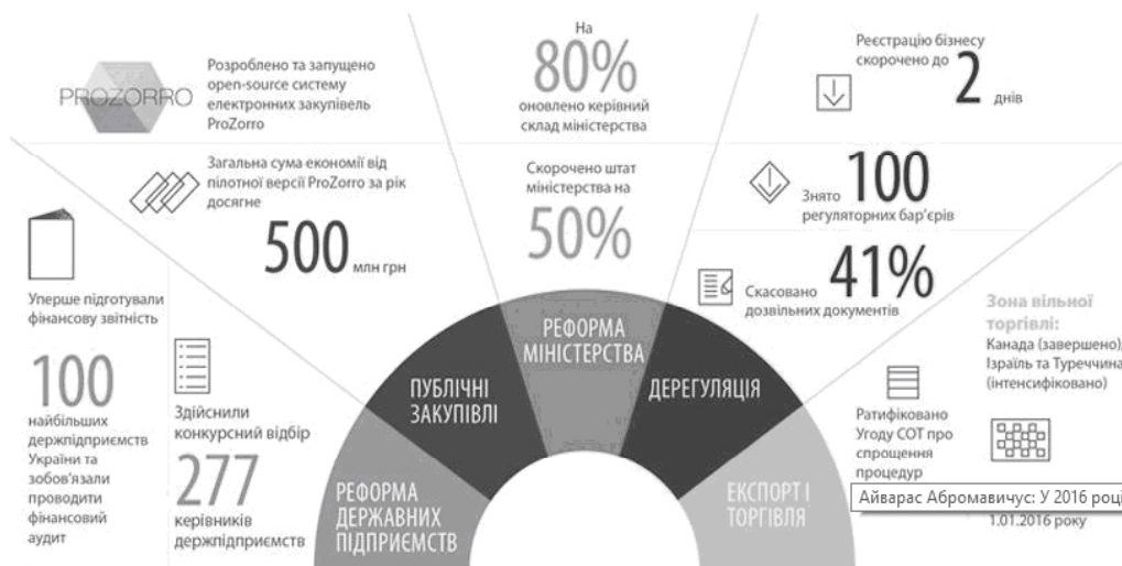
Рис. 2. Звіт Міністерства економічного розвитку і торгівлі України у 2016 р.

Приклад доповіді суб'єкта України про результати своєї діяльності подано на рис. 2 [11].