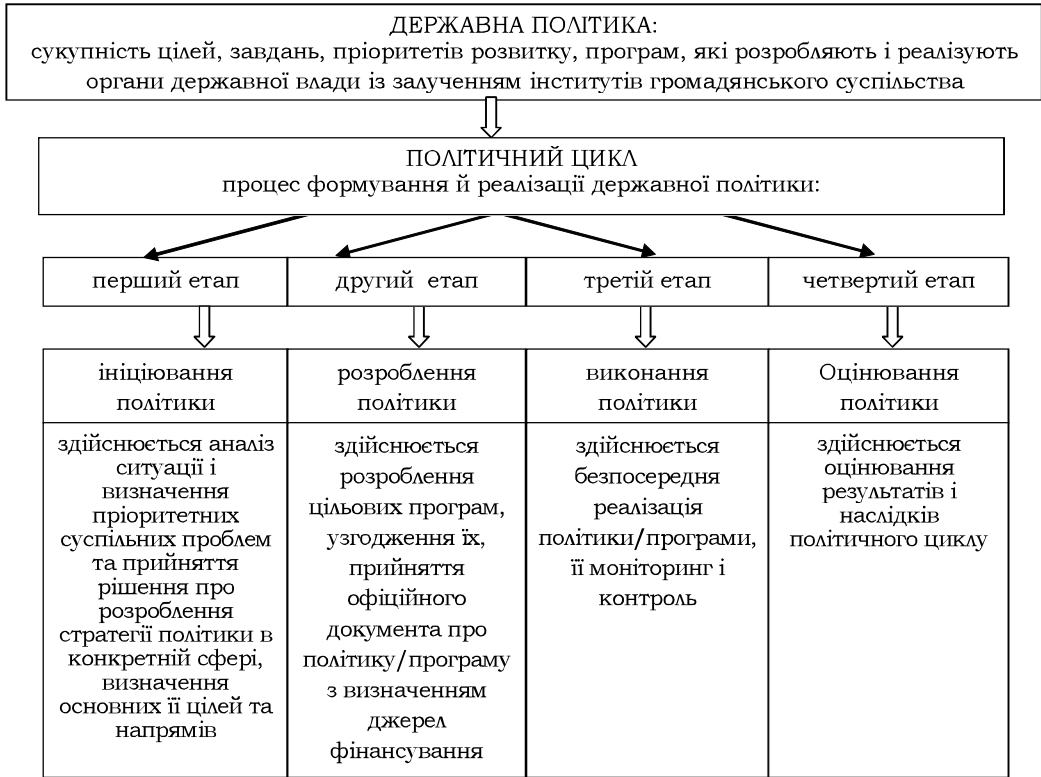
Рис. 2. Державна політика та її етапи і принципи. Сформоване автором за результатами дослідження

Державна політика має свій політичний цикл, що поділяється на чотири етапи, кожен з яких має свою характеристику та значущість (рис. 2).