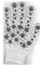
Рис. 1. Зображення промислового зразка за патентом України № 24307

Для наочності викладеного вище наведемо приклад із зображенням промислового зразка (Рис. 1).