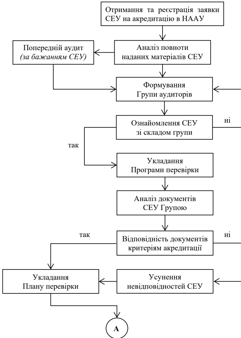
Рис. 1. Загальний алгоритм адміністративних процедур акредитації СЕУ України