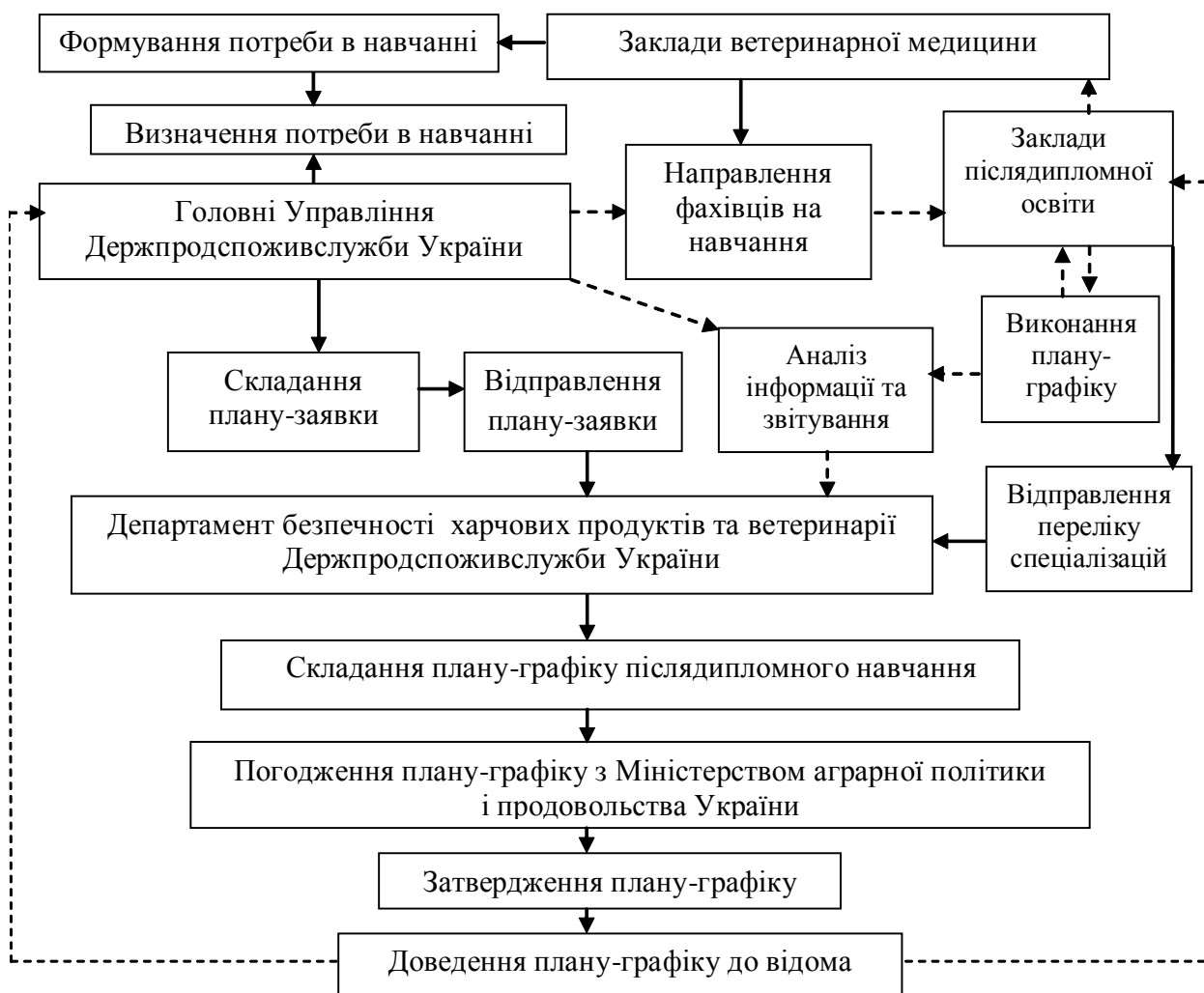
Рис.1. Схема процесу післядипломного навчання лікарів ветеринарної медицини в Україні (складено автором на підставі «Положення про післядипломну освіту лікарів ветеринарної медицини в Україні» [3])

Аналіз даних статистичної звітності вказує на те, що виконання планів відбувається досить нерівномірно, у деяких областях фіксуються факти порушення термінів проходження курсів, рівень формування заявок на складання планів-графіків є недостатньо високим.