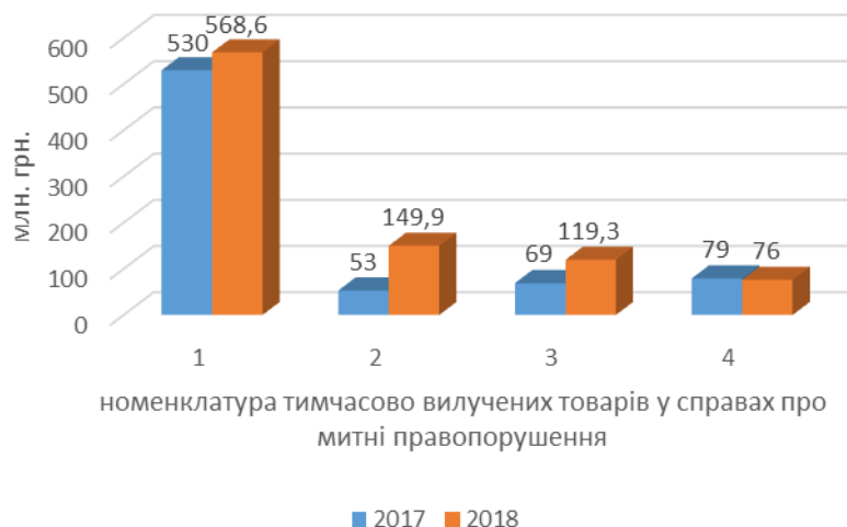
Рис. 2. Номенклатура вилучених товарів у справах про митні правопорушення: 1 – непродтовари; 2 – транспортні засоби; 3 – харчові продукти

Стратегією сталого розвитку “Україна – 2020” в світлі реформ згідно із вимогами євроінтеграції визначено одним з чотирьох пріоритетних векторів розвитку суспільства - вектор безпеки громадян [4]. Потрапляння на митну територію України за різними контрабандними схемами товарів, зокрема харчових продуктів не сприяє розвитку цього вектору. Так, за даними Державної фіскальної служби у 2017 – 2018 рр. у справах про митні правопорушення було вилучено непродовольчих товарів на суму (млн. грн): 568,6, транспортних засобів - 149,9, харчових продуктів – 119,3 (рис. 2) [2].