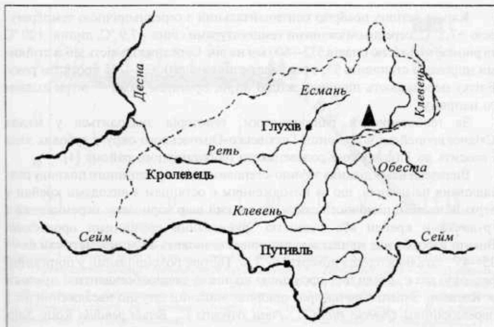
Рис. 1. Картохема розташування описаної лучно-степової ділянки на Придеснянському плато Fig. 1. The schematic map of the reported meadow-steppe locality in the Desna Plateau area

то — піднесену хвилясту акумулятивно-денудаційну рівнину з сильно розчленованим рельєфом і середніми висотами 180—225 м над р. м. на вододілах і 130 м над р. м. у заплавах річок. Глибина залягання давнього кристалічного фундаменту (південно-західний схил Воронежського кристалічного масиву) становить 300—350 м. Стратиграфічний профіль послідовно складають геологічні пласти таких груп: палеозойської, представлені пісковиками, алевролітами, глинами (потужність близько 100 м); мезозойської у складі мергелів, вапняків, крейди з високим вмістом карбонату кальцію (95 %) і потужністю шару 170—180 м. Відклади кайнозойської групи — леси і лесовидні суглинки потужністю 2—30 м — виступають ґрунтовірними породами для переважної площі плато [2, 5]. На них формуються сірі, темно-сірі лісові ґрунти та чорноземи опідзолені з профілем 75—80 см і вмістом гумусу 4,5—5,0%.