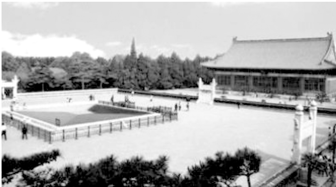
Рисунок 4. Пам'ятник ґрунтам в Імператорському саду (Пекін, Китай)

Біля витоків вчення про чорнозем, які передували В.В. Докучаєву і навіть Ф.Й. Рупрехту, були харківські вчені, професори Н.Д. Борисяк і І.Ф. Леваковський [2]. 30 серпня 1852 р. І.Ф. Леваковський виступив на зібранні Імператорського Харківського університету з доповіддю «Про чорнозем». Н.Д. Борисяк у праці «Про чорнозем», опублікованій 1852 р., обґрунтував наземно-рослинне походження чорноземів, описав їхні властивості і способи використання, дав класифікацію чорноземів (на суглинках, глинах, супісках, на елювії щільних карбонатних порід, солонцюваті, мочарні), вже в той час наголошував на необхідності охорони чорноземів [2].