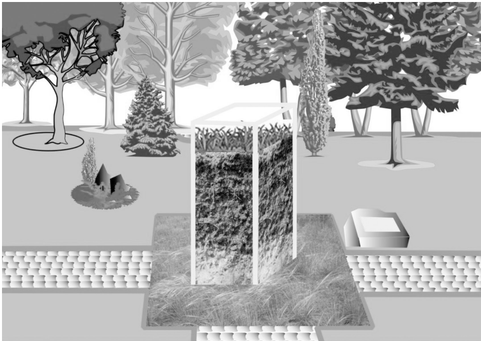
Рисунок 8. Проект пам'ятника цілинному чорноземові у Львові