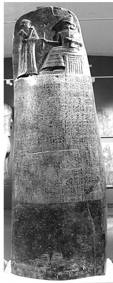
Рисунок 3. Стела із законами Хаммурапі

Надзвичайно цікавою й прогресивною для свого часу була комплексна геолого-геоморфолого-ґрунтова карта території від Балтійського моря до Дунаю і Дніпра, складена 1806 р. польським геологом С. Сташицем. У легенді до цієї карти є такі назви: «чорнозем – рослинна земля (Terres vegetables)», «степи пустельні (Camj deserti)», болотні і мергелісти ґрунти. Ця карта є своєрідною пам'яткою ґрунтів загалом і чорноземів зокрема.