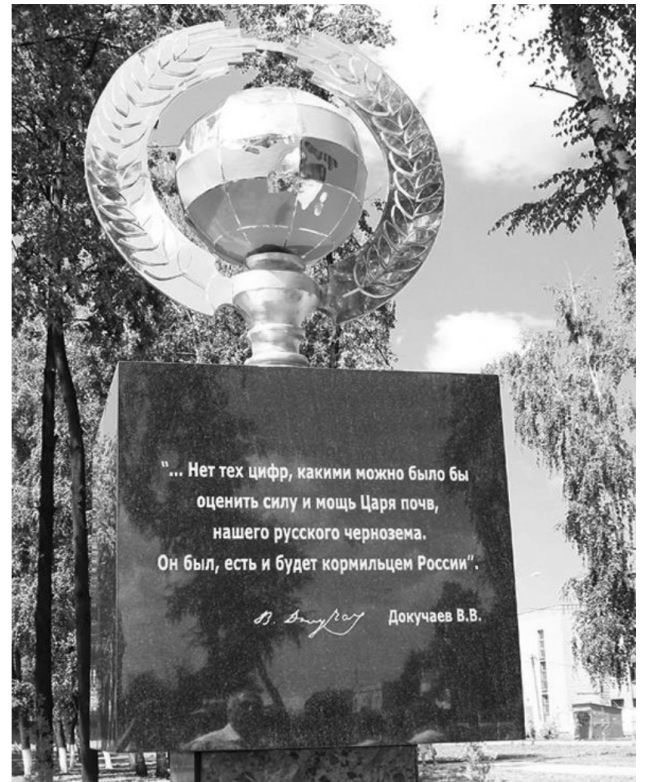
Рисунок. 5. Пам'ятник чорноземові в м. Паніно (Росія)

Цей чорнозем залягає на лесі. Під дереном із ковили та інших трав знаходиться горизонт А – майже однорідна маса, забарвлена гумусом у чорний колір, особливо у вологому стані; на цілині вона завжди пронизана численними живими і мертвими трав'янистими корінцями. Окремі складові горизонту, зазвичай у формі дрібних зерен, надають