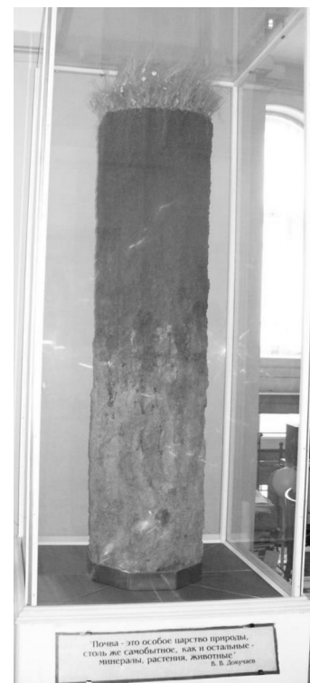
Рисунок 7. Моноліт чорнозему, Санкт-Петербург (Росія)

цього не сталося, його вирішили зберегти цілим і на підставі жеребкування він дістався Сорбонні, де зберігався до 1968 року, коли у Франції відбулися студентські заворушення і під час облоги будівлі університету скляні захисні стінки моноліту були розбиті, а експонат був зруйнований. Деякі великі його частини були передані Національному агрономічному інституту, де й зберігаються до цього часу [1].