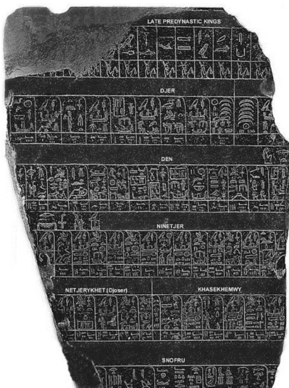
Рисунок 1. Палермський камінь (реконструкція)