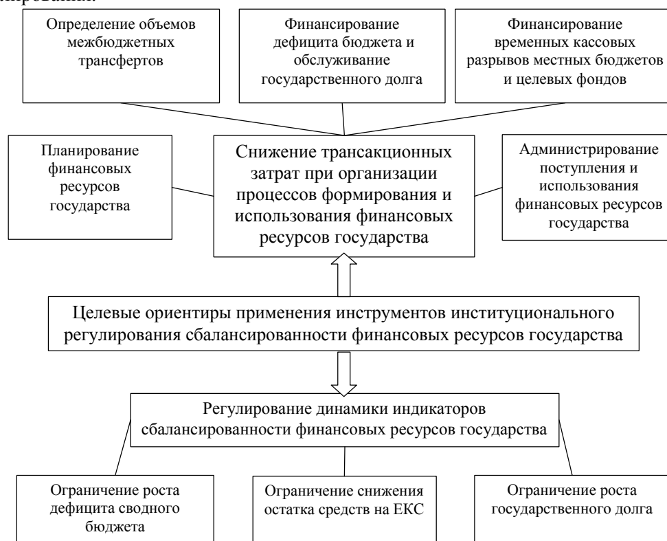
Рис. 2. Целевые ориентиры институционального регулирования сбалансированности финансовых ресурсов государства

Также отличаются и транзакционные издержки изменения вышеупомянутых институциональных правил. А значит, целесообразно ранжировать совокупность институциональных инструментов регулирования сбалансированности финансовых ресурсов государства, с точки зрения их приоритетности и значимости в целях регулирования.