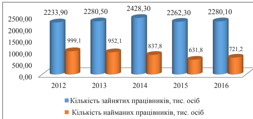
Рис. 2. Динаміка зайнятості населення в малому бізнесі за 2012–2016 рр.