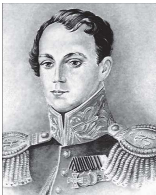
Александр Иванович Казарский