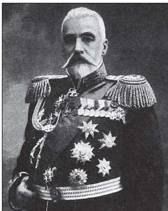
Иван Константинович Григорович