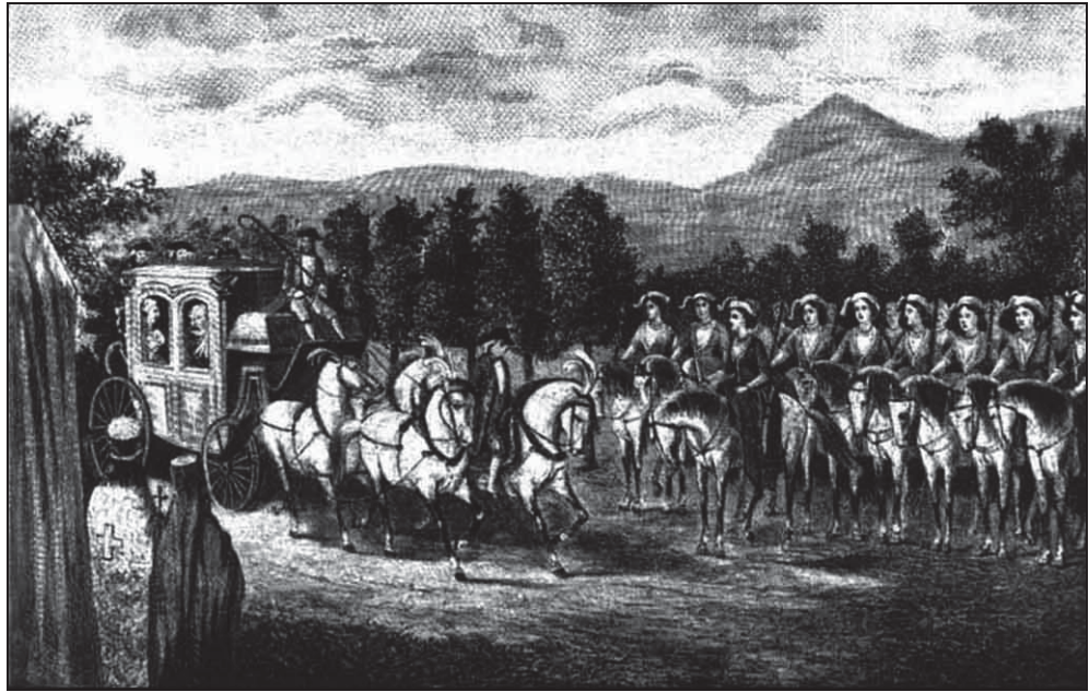
Путешествие Екатерины II в Крым