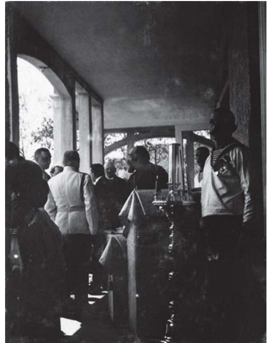
Царская Семья на освящении первого санаторного корпуса