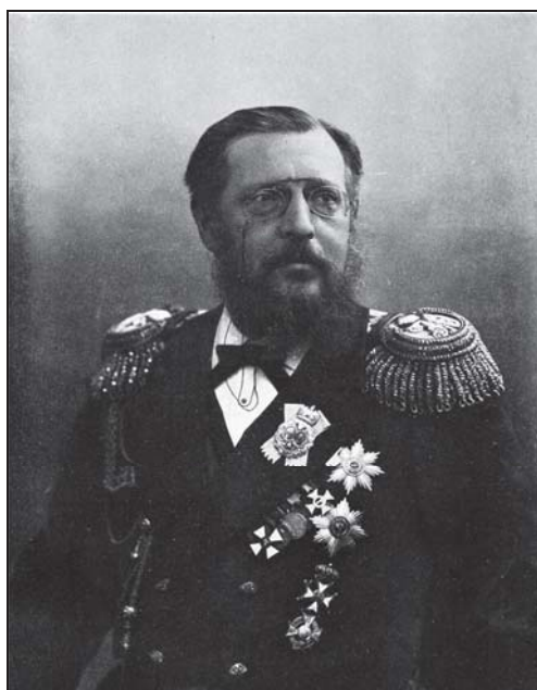
Великий князь Константин Николаевич