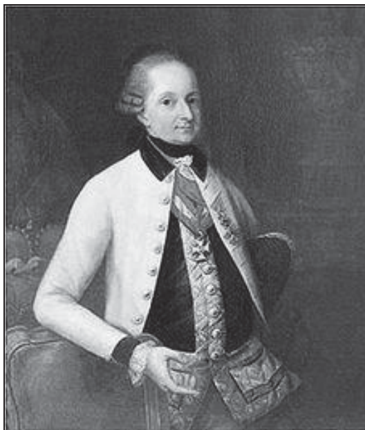
Миклош Иосиф Эстерхази (1714–1790)