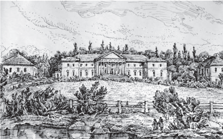
Іл. 1. Резиденція Ганських у Верхівні.

Особливо широкого розмаху будівництво заміських палаців набуло наприкінці XVIII — у першій половині XIX ст. на землях, які до 1792 року входили до складу Речі Посполитої. На момент зведення садиби стають основним місцем перебування поміщиків-дворян, предметом особистого престижу і свідченням могутності, набувають репрезентативного характеру та виконують функцію індикатора соціального статусу власника. На спорудження розкішних палацово-паркових ансамблів магнати витрачали величезні кошти. Неповторним та своєрідним був уклад садиб-