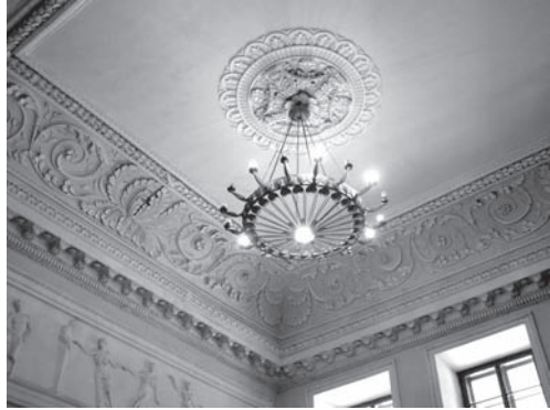
Лл. 6. Фрагмент бальної зали палацу.

Квартира О. Бальзака у верхівнянському палаці була розташована напрочуд сприятливо — вона займала південно-західну, найбільш забезпечену сонцем частину будівлі. У кабінеті, оздобленому тепер під мармур, зберігся старовинний кутовий камін, перед яким відігрівався від україн-