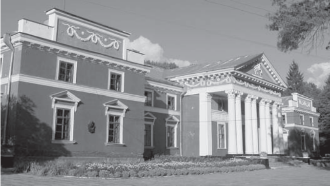
Іл. 2. Головний фасад палацу.

Точна дата зведення розкішного класицистичного палацу невідома. Польський дослідник Р. Афтаназі припускає, що він був споруджений лише після шлюбу В. Ганського з Е. Ржевською в 20-ті роки XIX ст., за проектом французького архітектора Блерію. Палацова композиція складається з головної двоповерхової будівлі і фланкуючих його одноповерхових флігелів, що утворюють біля палацу просторий двір. У композиції садиби флігелі є масштабним і архітектурно-художнім контрастом величному образу палацу. У цей самий час або трохи пізніше було зведено розташовані у межах парку домашню церкву, оранжерею та “мисливський павільйон”.