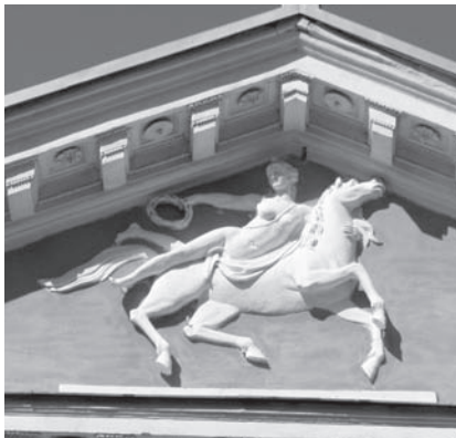
Іл. 4. Фрагмент портика головного фасаду палацу.

колонами і пілястрами утворювала галерею для оркестру, огорожену кованою залізною балюстрадою витонченого рисунку. Галерея мала напівкругле завершення, у рамі, скомпонованій з розеток. У деяких при-