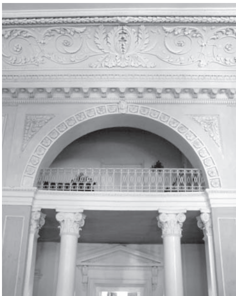
Іл. 5. Хори бальної зали палацу.

колонами і пілястрами утворювала галерею для оркестру, огорожену кованою залізною балюстрадою витонченого рисунку. Галерея мала напівкругле завершення, у рамі, скомпонованій з розеток. У деяких при-