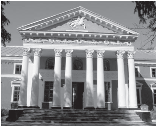
Іл. 3. Портик головного фасаду палацу.

Функціонуючий як piano nobile перший поверх палацу у центральній частині мав двостороннє анфіладне розпланування, а у крилах — складне, нерегулярне.