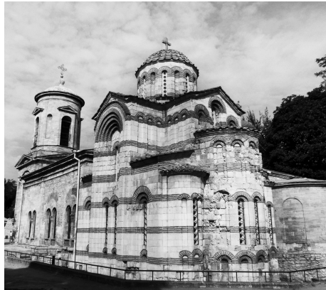
Іл. 1. Керч. Церква Іоанна Предтечі. Вигляд до (після Другої світової війни) та після реставрації. Автор реставрації Є. Лопушинська