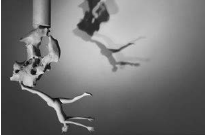
Іл. 5. Ян Мін. Про біг. Фарбований полімер. 2014

від маси війська. Серія Міна посіла чільне місце в експозиції виставки, сколихнувши уяву масштабами того, що відбулося в минулому: від майстерні вона перетнула виставковий простір і далі була вже реалізована на майдані Сохо.