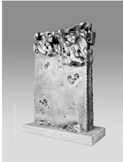
Іл. 6. Шен Цянгуо. Весняний камінь. Бронза. 2014

Духом мистецької свободи пройнята вся мистецька спадщина знаного в Китаї скульптора із Сучжоу Шен Цянгуо – монументально-просторова, станкова, декоративно-паркова, а також рівноцінний їм seamless art . Твором, який зробив відомим ім'я молодого скульптора стала монументальна композиція заввишки 8, 8 м, відкрита з нагоди 5-річчя Нового Сучжоу – району міста, що демонструє постіндустріальний динамізм та розвиток технологічного й культурно-мистецького прогресу. В істо-