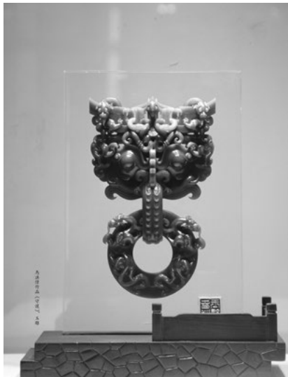
Іл. 3. Ма Хонвей. Нефрит

сучасній скульптурі. Так, на виставку Спільною було запрошено чимало видатних сучасних майстрів з усієї країни, зокрема: Лі Сянцзюнь, Цен Ченган, Лі Хе, Чжао Мен, Вей Сяомін, а також Цю Тайян і Ху Дунмін (родом із Тайваню), та Ян Цзицян, Цай Веньцзя, Се Дунлян (родом з Сінгапуру), що підняло престиж експозиції до міжнародного рівня.