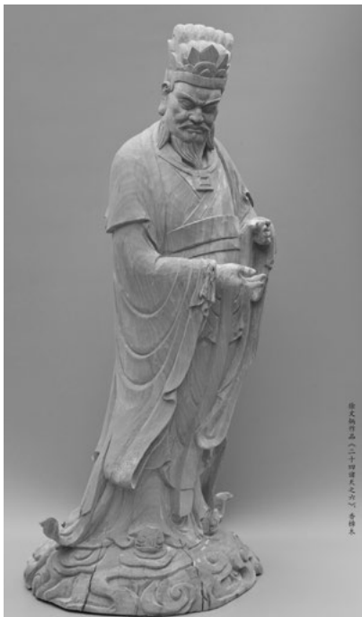
Іл. 4. Сю Венпін. Один із 24 богів. Дерево

Проте, головна роль була відведена місцевим сучасним художникам Сучжоу. Особливу увагу привернув модерністично транслітерований ряд історично знаних теракотових воїнів, що немовби повертали пам'ять до знаного класичного поховання восьмитисячної теракотової армії з гробниці імператора Цінь Шихуанді [10]. Модерністична «презентація» армії була успішно втілена в техніці полімеру головою спілки скульпторів