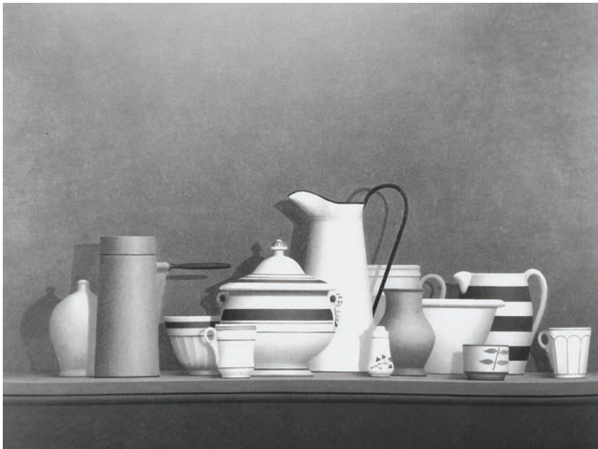
Вільям Бейлі. Натюрморт «Монтеркі». 1981

мали фігуративне підґрунтя. Проблема полягала лише в тому, як вмонтувати реальний об'єкт у сучасну, абстрактну, візуальну систему. Підсвідомо він постійно опонував авангардизму. Захоплення Енгром, Шарденом, Моранді підживлювало його внутрішню потребу мислити реальними формами.