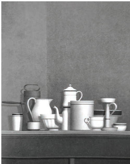
Вільям Бейлі. П'яца Фортебраціо. 1981

Бейлі був зачарований італійською провінцією, її духом і колоритом, які гармонійно співзвучні шедеврам італійського Відродження. Художник писав, що пропорції предметів певною мірою співпадають з тим, що він підсвідомо абсорбував з італійської міської архітектури. Дивлячись на картину, він