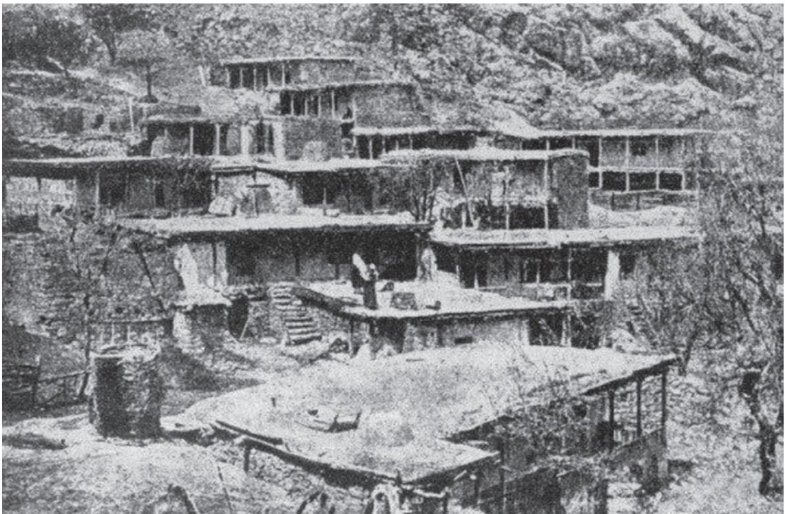
Ил. 1. Житло кримських татар у Шелені — селі гірських татів [тати — давня назва]. (Куфтин Жилище 73)

Дослідження й аналіз шляхом порівняння результатів натурних обстежень і літературних джерел допомогли локалізувати територію поширення кримськотатарської архітектури, розкрити просторові і візуальні зв'язки завдяки методу спрямованості, який передбачає послідовне визначення ролі й місця будинку, ансамблю у міському просторі, а також дали змогу прослідкувати та проаналізувати виникнення й еволюцію типологічно і стилістично однорідних груп архітектурних об'єктів та окремих елементів в їхній хронологічній послідовності.