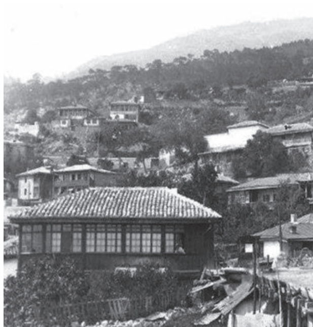
Іл. 4. Архітектура Гурзуфа. Початок ХХ ст. (Старовинні) Див. сайт: https://crimeanblog.blogspot.com/2017/01/gurzuf-photo.html