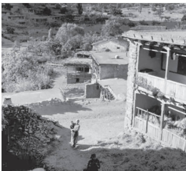
Іл. 2. Архітектура Криму у роки німецької окупації. 1943. (За рік до депортації). Див. сайт: < https://styler.rbc.ua/ukr/zhizn/god-deportatsii-zhili-tatary-krymu-stalinskih-1518359395.html >