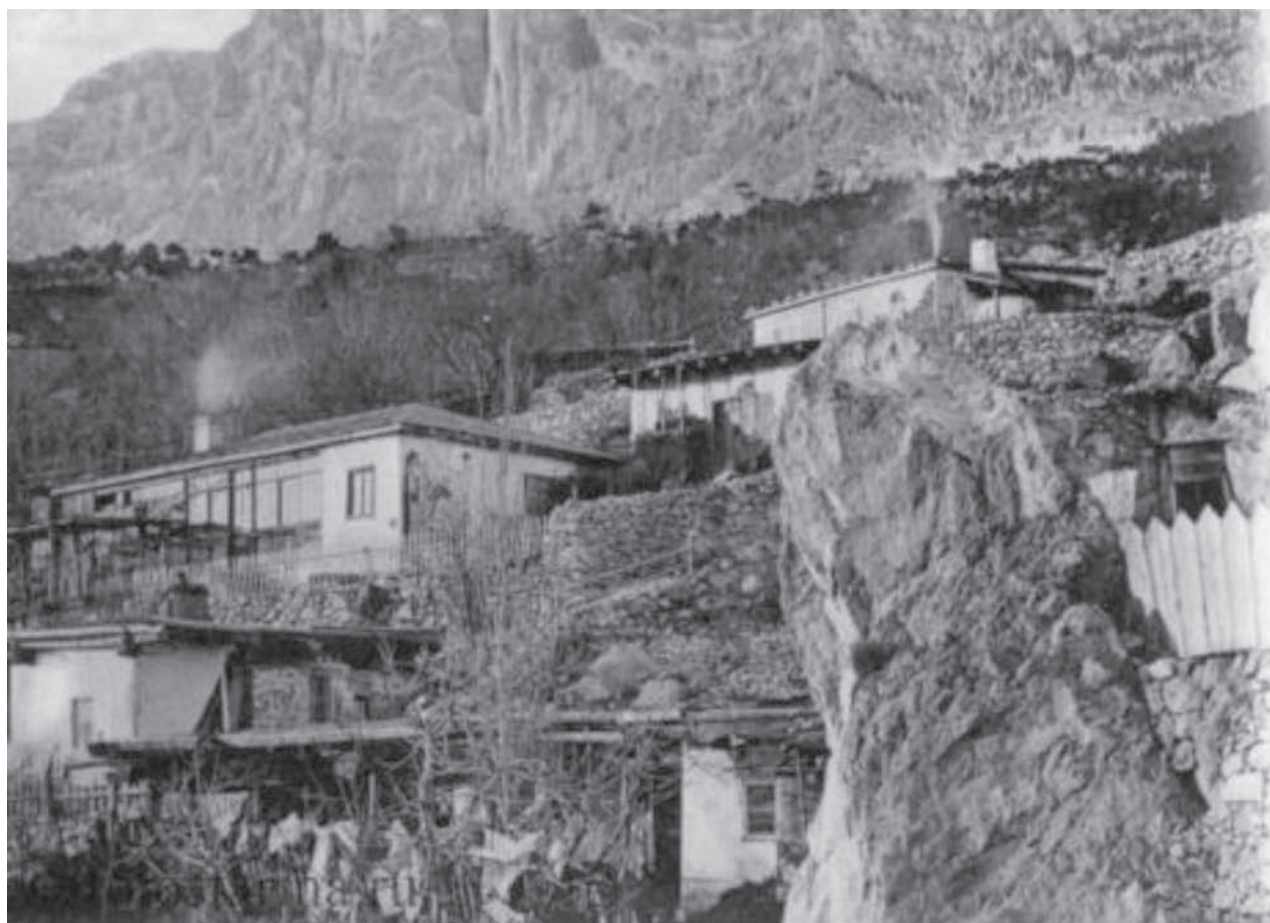
Іл. 3. Кримськотатарське житло у м. Алушка. Початок ХХ ст. (Старовинні) Див. сайт: https://crimeanblog.blogspot.com/2016/04/alupka-foto.html