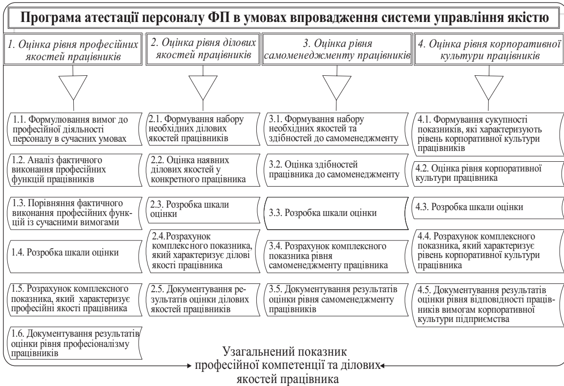
Рис. 3. Програма атестації персоналу промислових ФП в умовах впровадження системи управління якістю