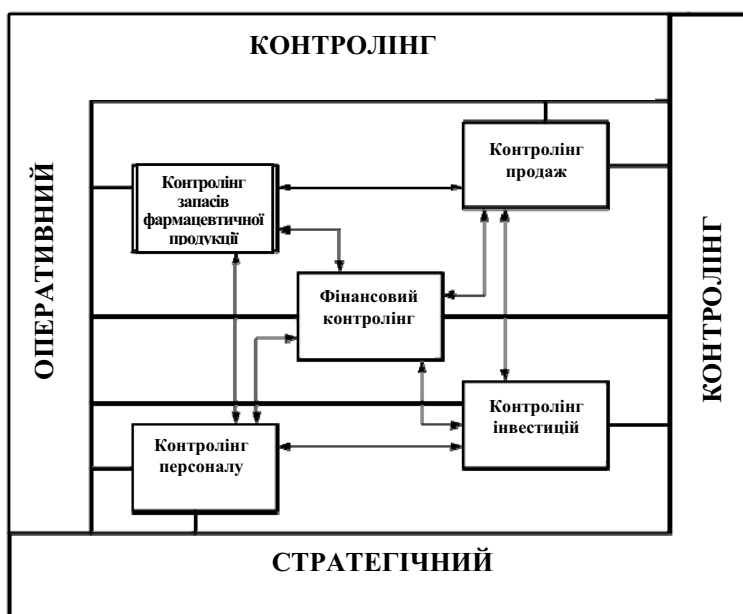
Рис. 1. Місце контролінгу запасів фармацевтичної продукції у системі управління ОФК [6]

Як показав проведений аналіз, для вирішення перерахованих завдань доцільно використовувати наступні спеціальні методи та інструменти: первинні дослідження у формі опитувань