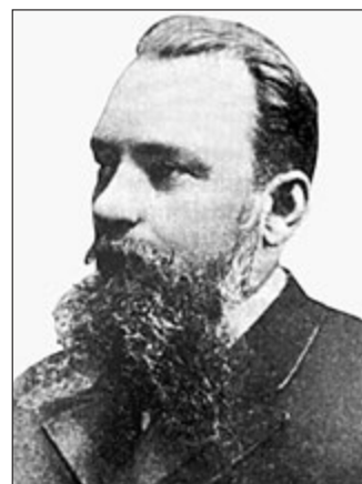
Стуковенков Михайло Іванович (1842—1897), перший завідувач кафедри дерматології і сифілітичних хвороб медичного факультету Університету св. Володимира

Ukrainian Journal of Dermatology, Venerology, Cosmetology