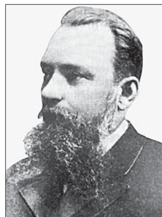
Стуковенков Михайло Іванович (1842—1897), перший завідувач кафедри дерматології і сифілітичних хвороб медичного факультету Університету св. Володимира

Ukrainian Journal of Dermatology, Venerology, Cosmetology