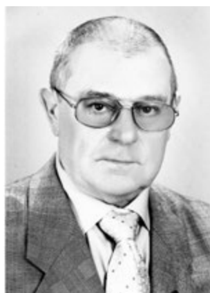
Рис. 15. Валерій Павлович Федотов (1939—2018)

В.Г. Чмут захистили кандидатські дисертації, у науковій пресі було опубліковано чотири монографії та понад 200 наукових праць різного формату. З доповідями на засіданнях обласного товариства і на конференціях виступали не тільки працівники кафедри, а й запрошені авторитетні дерматовенерологи. Це (далі вказані вчений ступінь і наукове звання, чинні на період з 1972 до 1985 р.): з Москви — доктор медичних наук, професор, член-кореспондент АМН СРСР Юрій Костянтинович Скрипкін (1929—2016) (рис. 11); з Києва — доктори медичних наук, професори Борис Тихонович Глухенький (1925—2015) (рис. 12), Володимир Григорович Коляденко (1935—2013) (рис. 13); з Харкова — доктор медичних наук, професор Іван Іванович Мавров (1936—2009) (рис. 14); з Донецька — доктор медичних наук, професор Микола Олександрович Торсуєв (1902—1978); із Запоріжжя — доктор медичних наук, доцент Валерій Павлович Федотов (1939—2018) (рис. 15); з Тернополя — доктор медичних наук, професор Ніна Іванівна Тумашова (1922—2006) (рис. 16).