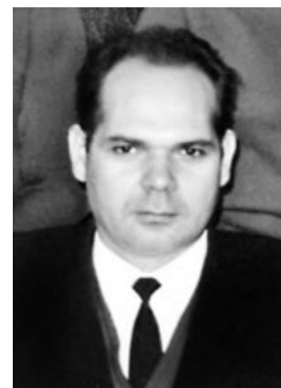
Рис. 9. Віктор Романович Сорока (1930—2002)