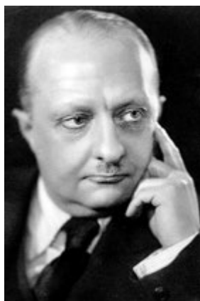
Рис. 8. Олександр Федорович Тур (1894—1974)

У цей час велася активна науково-дослідна робота. Асистент В.А. Чипіженко й аспірант