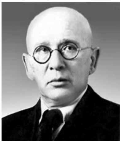
Рис. 4. Марк Тимофійович Бриль (1889—1967)