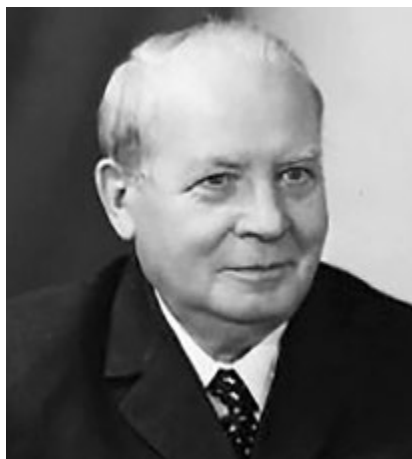
Рис. 5. Іван Іванович Потоцький (1898—1978)