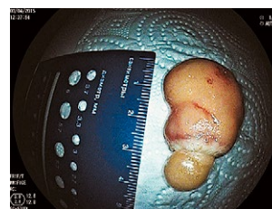
Рис. 3 Розмір новоутворення