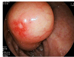
Рис. 1 Ліпома в просвіті сигмоподібної кишки

Обов'язкове проведення при наявності в клініці ендоскопічної соннографії або альтернативний метод підслизової ін'єкції фізіологічного розчину з метою гідросепарації та визначення інвазії новоутворення.