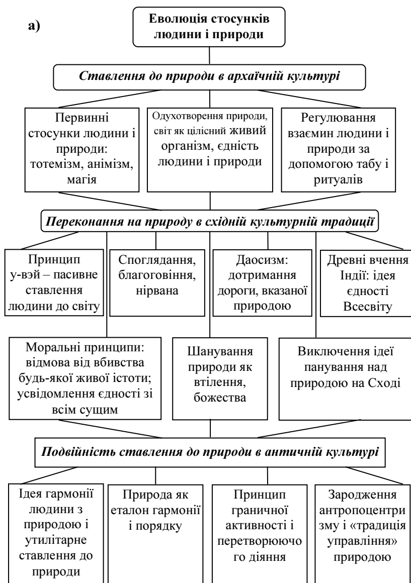
Рис. 2. (а) Еволюція стосунків людини і природи (початок)

У Новий час ідея панування людини в природі стає провідною в суспільній свідомості XVII-XVIII ст. Підставою панування з'явилися експериментальна наука і математичне природознавство, а також механістична картина світу. В той період проголошується створення таких філософських систем («практична філософія» Р. Декарта) і таких принципів пізнання (Ф. Бекон), які сприяли б обґрунтуванню ідеології панування людини в системі природних зв'язків і стосунків. Така парадигма екологічного мислення стала переважати у всіх техногенних цивілізаціях аж до нашого часу. На гармонійне взаємовідношення з природою були орієнтовані культури Стародавнього Сходу, романтична традиція в західній думці, філософія російського космізму і ін. Істотний внесок у розвиток ідеї гармонізації стосунків людини і природи внесли класики марксистської філософії – К. Маркс і Ф. Енгельс. Для формування екологічної свідомості велике значення мали екологічні ідеї, що містяться у працях вчених-натуралістів кінця XIX – першої пол. XX ст. (Е. Геккеля, В. Докучаєва, К. Мебіуса, Е. Зюсса, В. Вернадського та ін.), у працях яких закладені екологічні основи уявлень про ґрунт, біогеоценоз, біосферу.