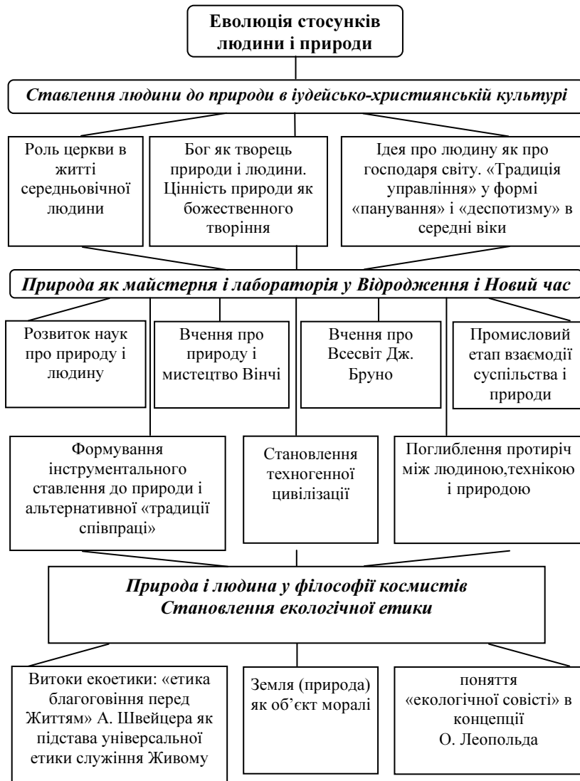
Рис. 2. (б) Еволюція стосунків людини і природи (продовження)

У другій пол. XX ст. низку важливих екологічних ідей висунули також зарубіжні вчені-філософи, політики, економісти та екологи, а саме: ідею технічного панування над природою (П. Тейлор), ідею переходу до екологічної концепції економіки (Д. Медоуз, А. Печчеї та ін.), ідею нездатності вільного капіталістичного господарства гармонізувати ставлення людини і природи на основі формування ідеї посилення державного регулювання взаємодії суспільства і природи (Ф. Санбім, К. Хухер), ідею обмеженості природних ресурсів і на цій основі примушення людей через політичні інститути для їхнього порятунку (У. Офалз) й ін. Широкий спектр тлумачень проблеми людини і її цінностей дала остання третина XIX – початок XX ст.: від позитивістського раціоналізму (М. Драгоманов, І. Франко та ін.), концепції ноосфери В. Вернадського та екзистенціальних поглядів Лесі Українки, М. Коцюбинського, В. Винниченка до панпсихізму та спірітуалізму (О. Козлов, О. Гіляров), неокантіанства (Г. Челпаков), емпіріокритицизму (В. Лесевич), релігійно-теїстичної філософії (В. Ліницький, В. Кудрявцев).