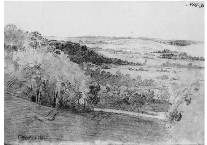
Рис. 1. 09. Урочище Стінка. Папір, олівець (17 × 24,2). [V – X 1845]*.

Малюнок «Стінка» розміщений у повному зібранні творів Т. Г. Шевченка у томі VII, книзі II за № 309 (рис. 1).