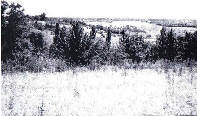
Фото 1. Урочище «Стінка» біля ст. Сердюківка, 1997 р.

– реальне урочище і зображене на малюнку мають схожі панорами і ряд спільних ознак: явний, виступаючий зліва в долину, мис; хутір у долині; круту, звивисту дорогу, що збігає до долини.