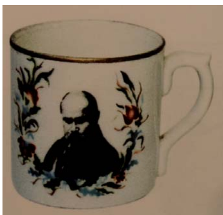
4. Кухлик. Фарфор, деколь, розпис. Кінець 1930-х рр. Довбиський фарфоровий завод [20, с. 117, світлина]