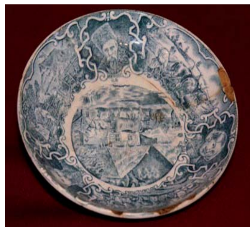
4. Автор невідомий. Тарілка. Фарфор, друк. Будянський фаянсовий завод