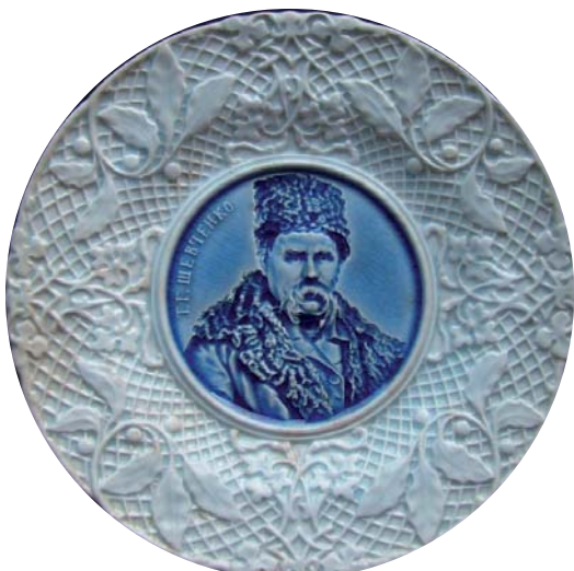
1. Автор невідомий. Таріль. Фаянс, відливання, полива. 1860-ті рр. Києво-Межигірська фабрика. Приватна колекція