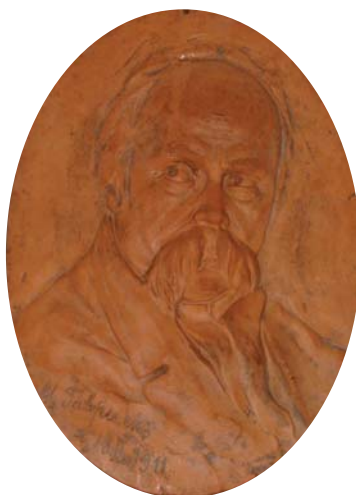
6. М. Гаврилко. Плакетка. Глина, відтискання. 1911 р. Приватна колекція