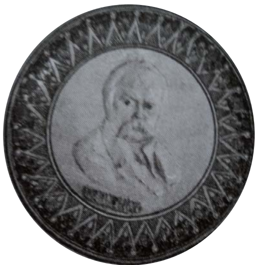
1. М. Волощук. Таріль. Глина, відтискання, розпис. 1920-ті рр. с. Кути Івано-Франківської обл. [8, с. 87]