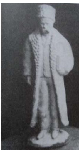
5. В. Поросний. Тарас Шевченко. Глина, відливання. Початок XX ст. [14, с. 253]