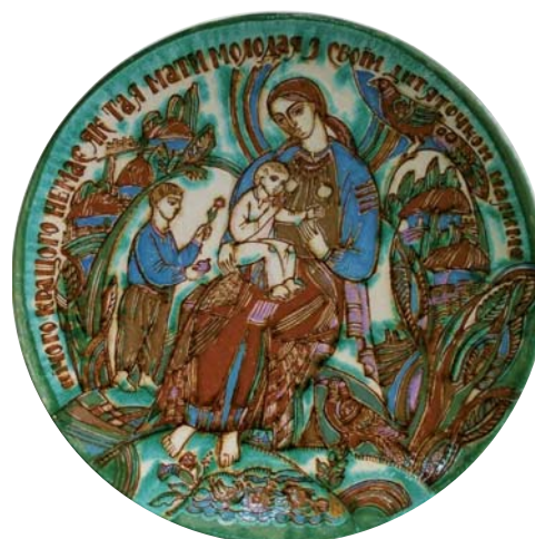
6. П. Печорний. Таріль «...Нічого кращого немає...». Глина, розпис, полива. Початок XXI ст.