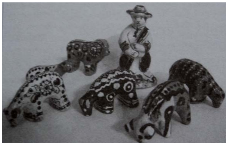
3. В. Аронець. Композиція «Мені тринадцятий минало». Глина, ліплення, розпис, полива. 1963 р. м. Косів Івано-Франківської обл. [5, с. 128]