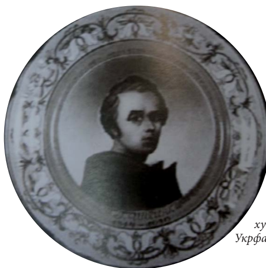
5. П. Іванченко. Таріль. Фарфор, розпис. 1939 р. Центральна художня лабораторія Укрфарфорфаянстресту. За О. Шкільною [19, с. 64, світлина]