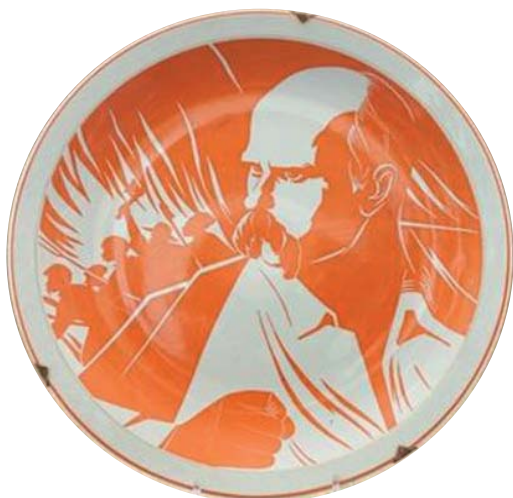
5. І. Ткаченко. Таріль «...Громадою обух стались...». Фарфор, відливання, розпис. 1963 р. Коростенський фарфоровий завод. Приватна колекція [25]