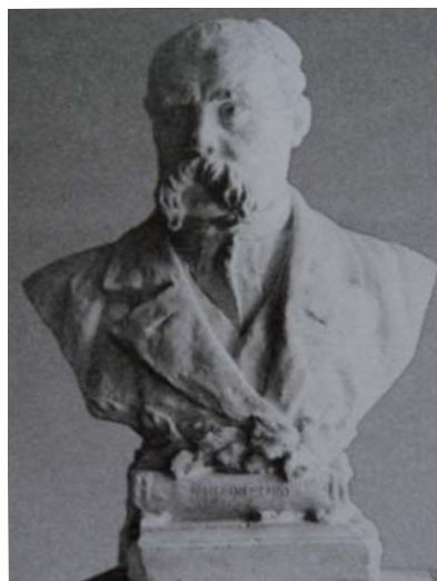
2. Ф. Балавенський. Бюст Тараса Шевченка. Фарфор, відливання. 1903 р. Національний музей Тараса Шевченка [18, с. 308]