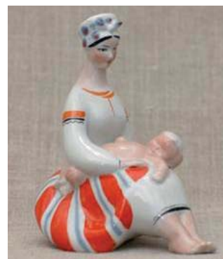
4. В. Трегубова. Скульптура «...Нічого кращого немає...». Фарфор, відливання, розпис. Початок 1960-х рр. Коростенський фарфоровий завод. Приватна колекція [25]