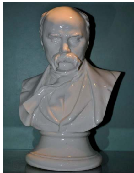
2. Автор невідомий. Бюст Тараса Шевченка. Фарфор, відливання. 1950–1960-ті рр. Баранівський фарфоровий завод. Приватна колекція