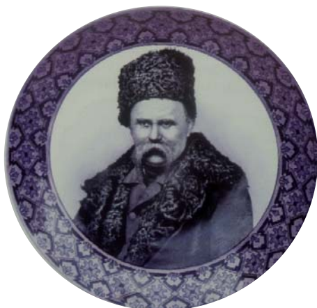
3. Я. Корицький. Таріль. Фарфор, розпис. 1911 р. Миргородська художньо-промислова школа імені Миколи Гоголя. Миргородський краєзнавчий музей [20, с. 41, мал.]