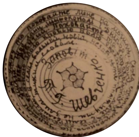
2. Г. Сергієнко. Миска. Глина, гончарний круг, розпис. 1924 р. (?) м. Канів Черкаської обл. [4, с. 153, 159]