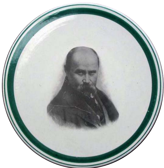
1. Автор невідомий. Таріль. Фаянс, друк. Кінець 1940-х рр. Будянський фаянсовий завод. Приватна колекція