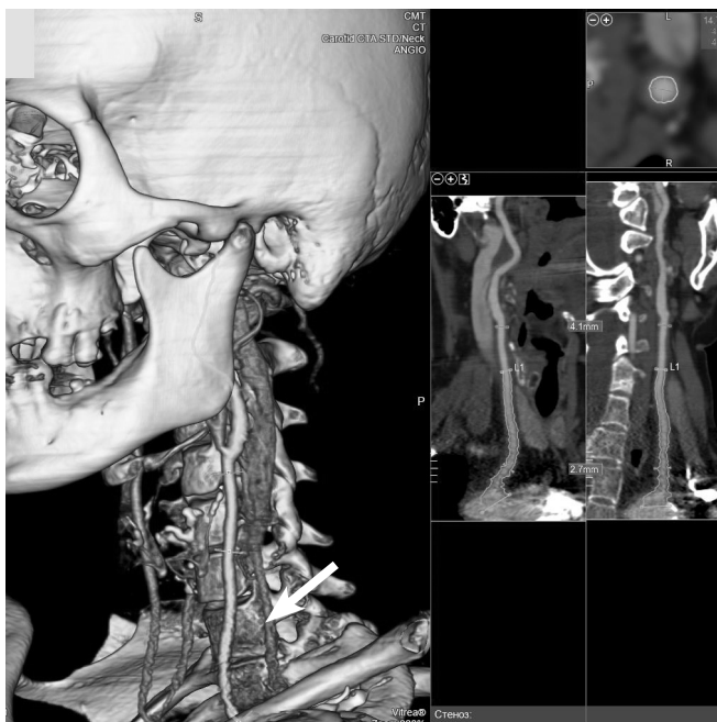
Рис. 2. Результати КТ-ангіографії (06.2020, ефективна еквівалентна доза 3 мЗв; контрастне посилення: омніпак): потовщення (до 2,7 мм) стінки загальної сонної артерії і нерівномірність контуру стінки артерії (вказано стрілкою).

трексамом у дозі 20 мг на тиждень, фолієвою кислотою й аторвастатином у дозі 30 мг на добу.