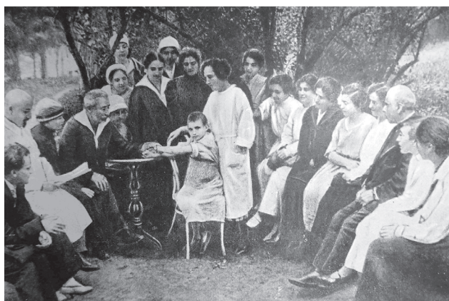
Мал. 4. Засідання педіатричного студентського наукового гуртка у саду під головуванням професора О.А.Киселя

Олександр Андрійович вважав, що робота в гуртку привчає студентів до серйозного вивчення спеціальності, розширює уяв-