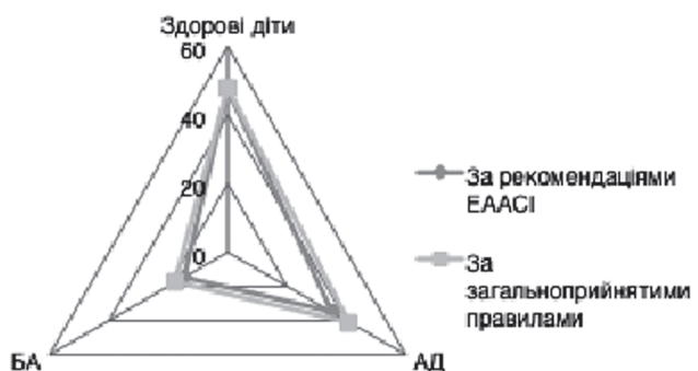
Рис. 2. Частота маніфестації алергічних захворювань в залежності від характеру харчування мами в групах дітей, що знаходились на природному вигодовуванні.