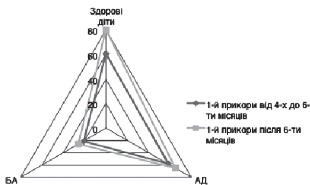
Рис. 3. Частота маніфестації алергічних захворювань в залежності від часу введення першого прикорму.

Аналіз маніфестації алергічних захворювань у дітей залежно від часу введення першого прикорму виявив, що у групі дітей, що отримали прикорм у віці від 4 до 6-ти місяців, частота маніфестацій алергічних захворювань достовірно не відрізнялась від дітей, яким перший прикорм вводився після 6-ти місяців. Так, частота маніфестацій АД 42% (n=58)–1 група та 38% (n=65)–2 група; БА 15% (n=21)–1 група та 15% (n=26)–2 група, відповідно, p>0,95^* . Частота маніфестації алергічних захворювань в залежності від часу введення першого прикорму представлена на Рис. 3.