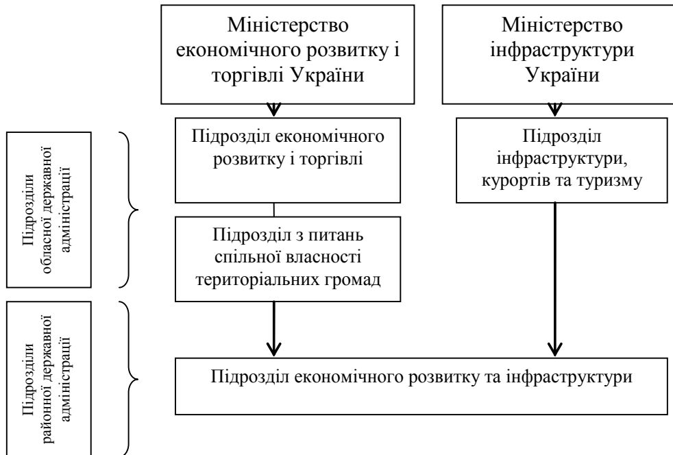
Рис. 2. Схема оптимізації органів виконавчої влади на місцях в економічній сфері

законодавства, поліпшення кадрового, інформаційно-технічного і фінансово-економічного забезпечення організації виконавчої влади та місцевого самоврядування.