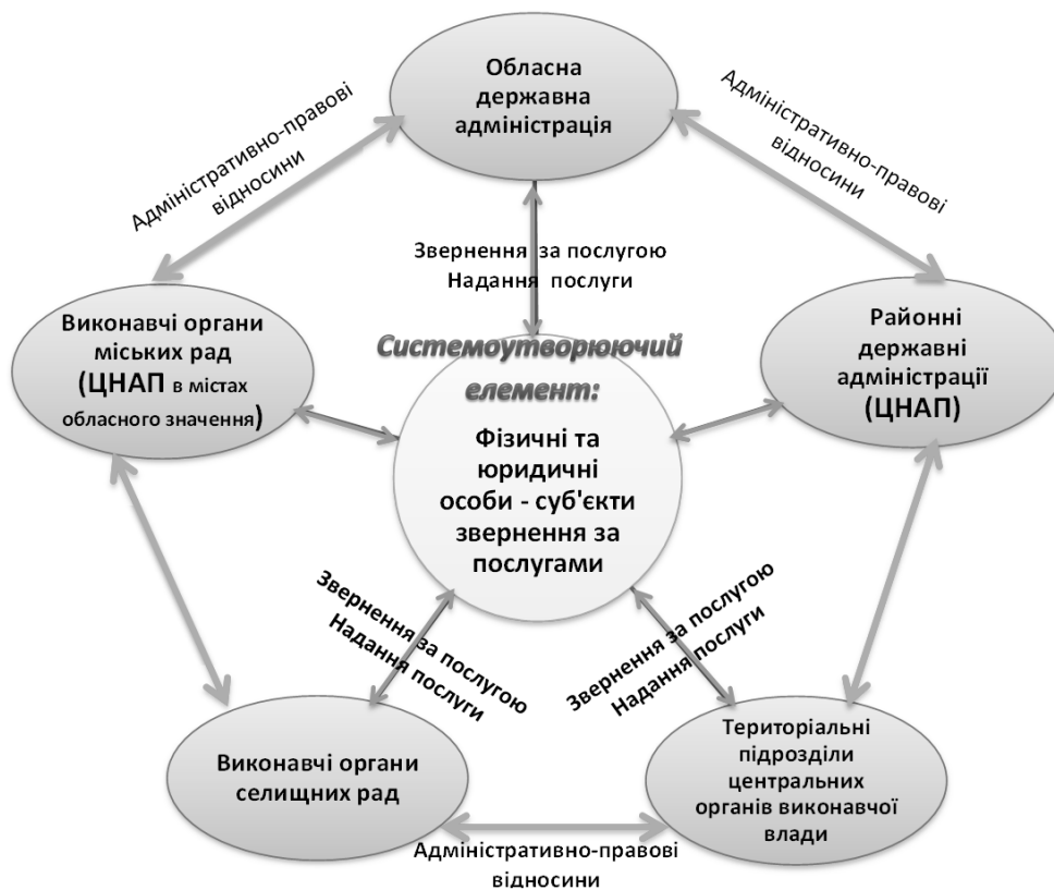
Рис. 2. Регіональна підсистема надання адміністративних послуг

власності тощо. Повноваження обласних та районних держадміністрацій поширюються на території відповідних областей або районів; до їх основних завдань входить забезпечення виконання розпорядчих актів органів виконавчої влади вищого рівня, державних і регіональних програм соціально-економічного, культурного розвитку тощо, підготовка та виконання відповідних бюджетів. Органи місцевого самоврядування (сільські, селищні, міські ради) представляють відповідні територіальні громади та здійснюють від їх імені та в їх інтересах функції і повноваження місцевого самоврядування, визначені законодавством. Громадяни та юридичні особи є елементами системи, якщо у процесі своєї життєвої чи господарської діяльності потребують певних змін або підтвердження у своєму юридичному статусі тощо, що можуть і повинні реалізувати вище зазначені суб'єкти владних повноважень.