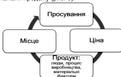
Рис. 3. Маркетинговий комплекс

Для просування готельних послуг застосовують маркетингову модель 7Р, яка складається з таких компонентів: продукт, тобто люди, процес виробництва, матеріальні фактори; ціна; просування; місце споживання та канали продажу (рис. 3).