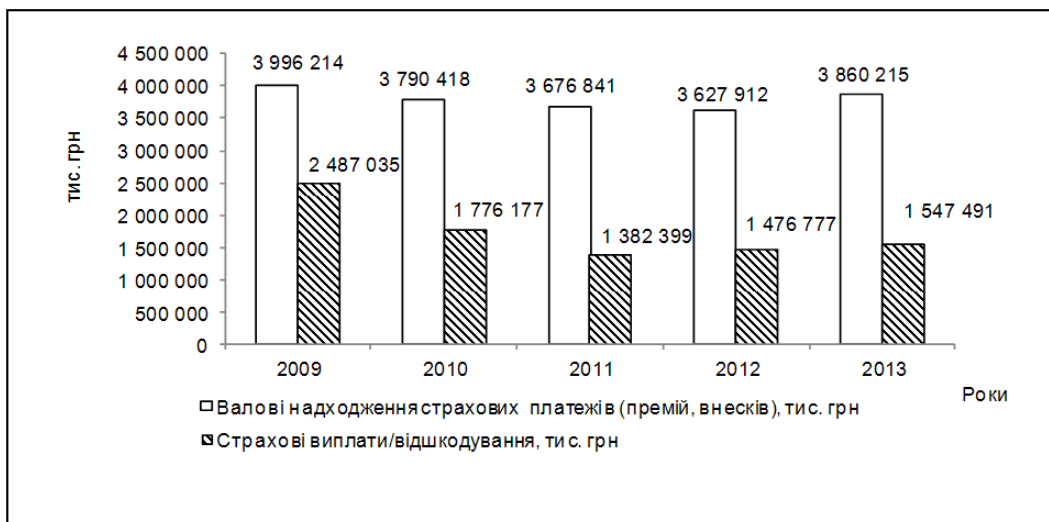
Рис. 3. Динаміка страхових платежів та виплат за КАСКО

Наступним етапом дослідження є аналіз витрат страховиків, основними з яких є страхові виплати (рис. 3) [6].